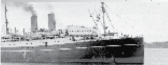
Le Royal Mail Ship Metagama , Canadian Pacific Steam Ship Lines, juin 1927 (PA-166332)