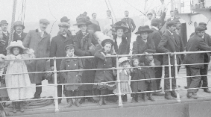
Immigrants sur le point de débarquer, vers 1911 (PA-010235)