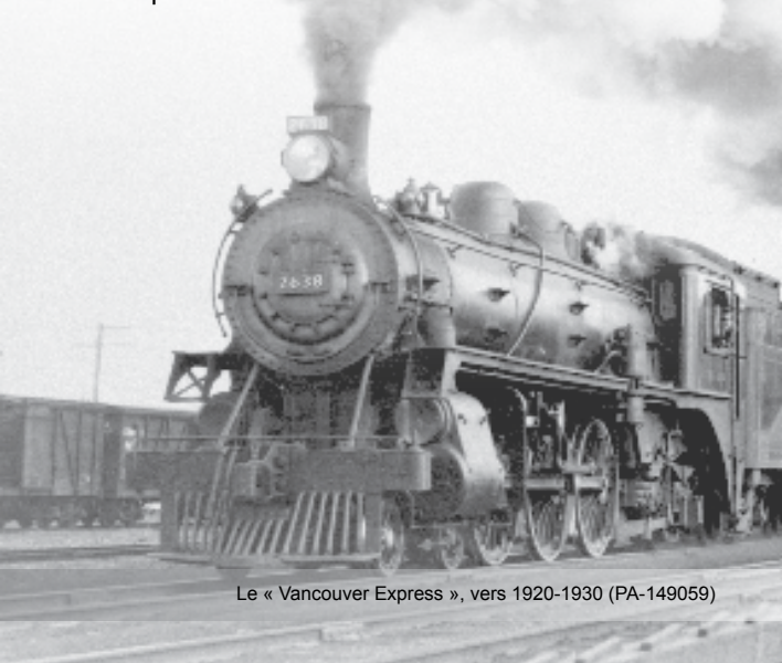
Le « Vancouver Express », vers 1920-1930 (PA-149059)

Visitez le site Web de Bibliothèque et Archives Canada, au www.collectionscanada.gc.ca , pour en savoir plus sur ses collections.