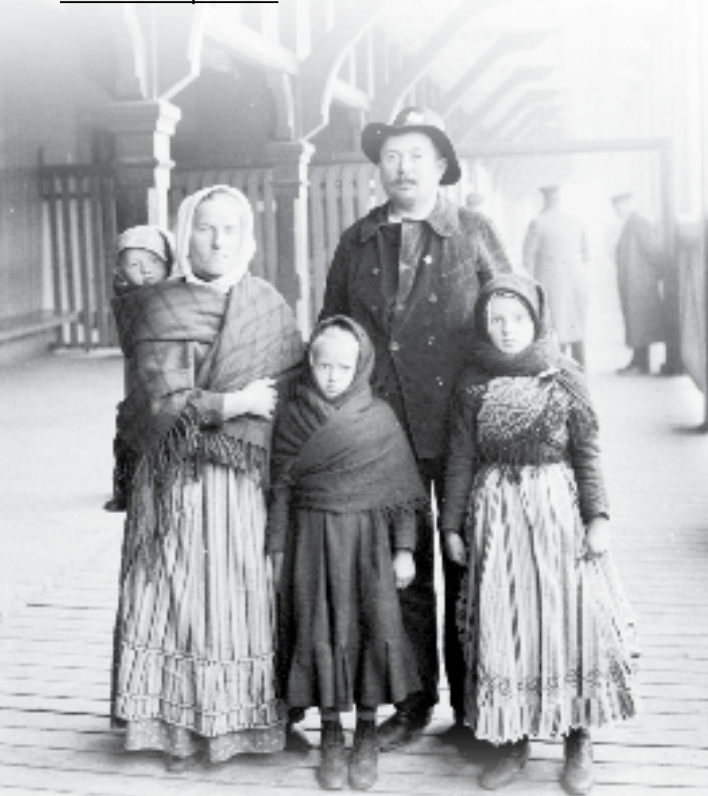
Immigrants allemands, vers 1911 (PA-010254)

Les demandes par courrier électronique doivent être envoyées par l'entremise de notre site Web au www.collectionscanada.gc.ca/genealogie en utilisant le formulaire en ligne accessible sous Poser une question .