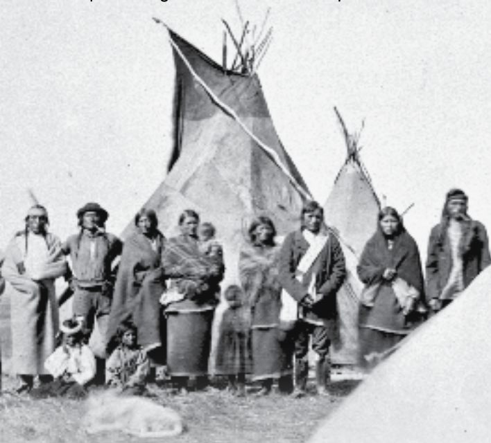
Un groupe d'indiens Dakota (Sioux) à Turtle Mountain, 1873-1875 (PA-074652)

Afin de déterminer si un de vos ancêtres était d'origine autochtone, il vous faut premièrement faire votre généalogie. En utilisant des sources généalogiques usuelles, trouvez le nom de vos ancêtres, les dates de naissance, de mariage et de décès ainsi que leur lieu de résidence. Les recensements constituent souvent la seule source indiquant l'origine autochtone d'une personne.