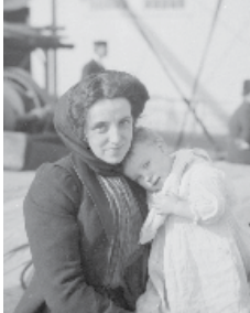
Une mère immigrante et son enfant à leur arrivée en provenance d'Écosse, vers 1911 (PA-010151)