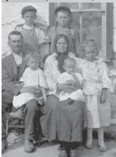
Une famille d'immigrants russes sur une ferme en Saskatchewan, 1922 (PA-019079)