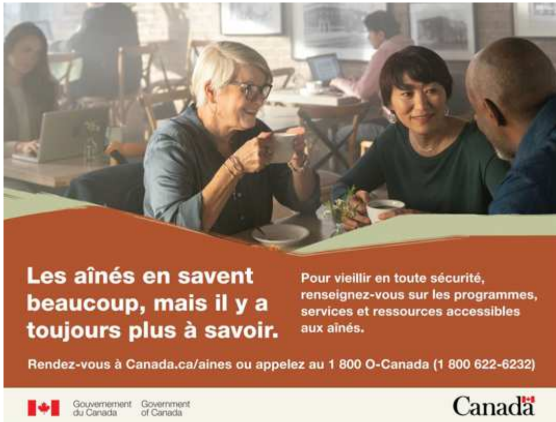
Image d'aînés dans un café. Le texte se lit comme suit : “Les aînés en savent beaucoup mais il y a toujours plus à savoir. Pour vieillir en toute sécurité, renseignez-vous sur les programmes, services et ressources accessibles aux aînés. Rendez-vous à Canada.ca/aines ou appelez au 1 800 O-Canada (1 800 622-6232)”