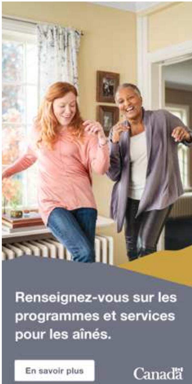
Image d'aînés dansant dans une maison. Le texte se lit comme suit : "Renseignez-vous sur les programmes et services pour les aînés."