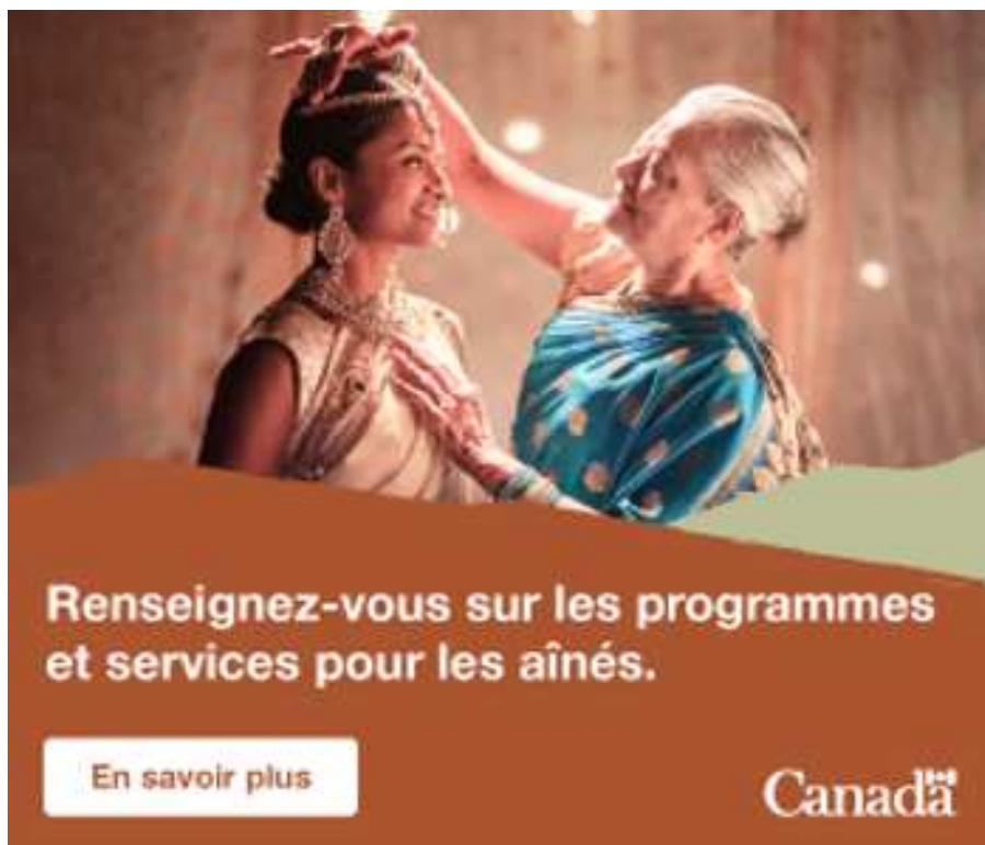
Image d'une femme âgée fixant les cheveux d'une autre femme. Le texte se lit comme suit : "Renseignez-vous sur les programmes et services pour les aînés."