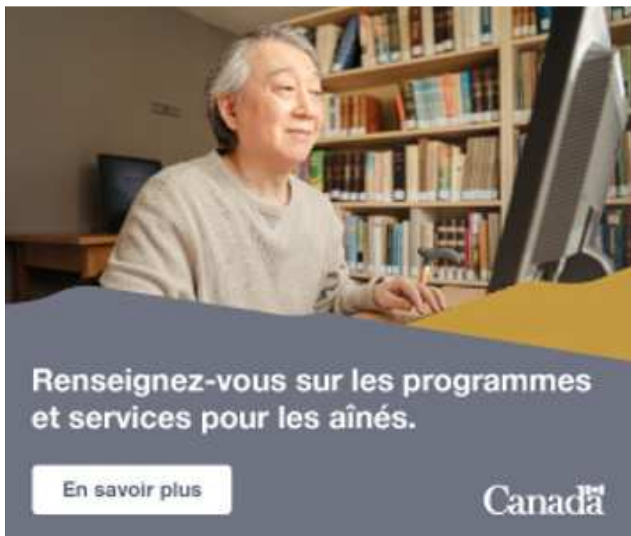
Image d'un homme âgé utilisant un ordinateur. Le texte se lit comme suit : "Renseignez-vous sur les programmes et services pour les aînés."