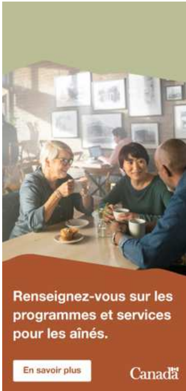
Image d'aînés dans un café. Le texte se lit comme suit : "Renseignez-vous sur les programmes et services pour les aînés."