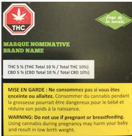
Tableau 21 : Devant du paquet