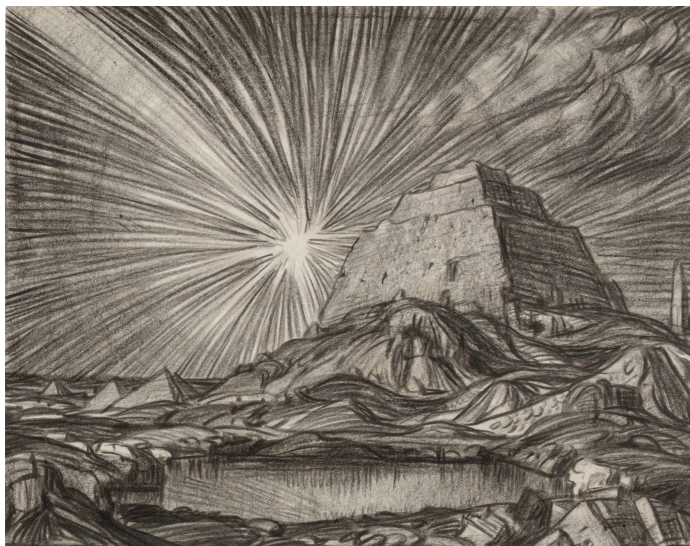
К. Ф. Богаевский. [Пейзаж]. 1911. Бумага, угольный карандаш.

Начиная с 1907-го, статьи Волошина о художнике печатались в журналах «Золотое руно», «Аполлон», «Русская мысль». В то же время живописные пейзажи Богаевского — «Пустынная страна» (1905), «Пейзаж со скалами» (1908), «Жертвенники» (1907—1908), «Киммерийские сумерки» (1911) и другие — словно гигантские зеркала вторили стихам поэта.