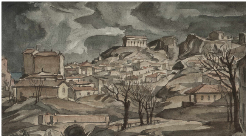
К. Ф. Богаевский. [Город]. 1900-е. Бумага, акварель.

протекает, беспритязательная, скромная, не тормоша тебя и не волнуя. Зато как же и мечтается до забвения в таком болоте! Горит душа и тоскует. В мечтах создаешь себе другой, неведомый, сказочно далекий и прекрасный мир. Право, не будь жизнь такой скучно-серенькой вообще, не было бы на земле ни мечты огненной, ни художеств всяких». 14