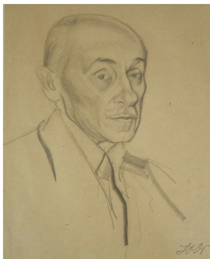
Ю. Л. Оболенская. Портрет К. Ф. Богаевского. 1928. Бумага, карандаш.

По пустыням древней Киммерии, ставшей «истинной родиной его духа», поэта провел Константин Богаевский.