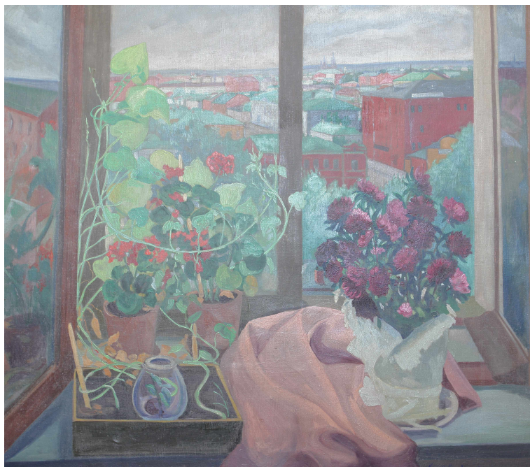
К. В. Кандауров. [Окно]. 1917. Холст, масло.

куства, преломленной философской идеей общего дела. Людей сближало и удерживало друг возле друга понимание творчества как главного смысла человеческого существования, оправдания жизни, а совместные устремления на этом пути перекрывали обременение социальных, материальных или семейно-бытовых «условностей». Поэтому мастерская важнее уютного вместилища обыденности, творимое и творящееся превыше обывательских устоев, а образ дома подчеркивает его смысл и суть — Дом Поэта.