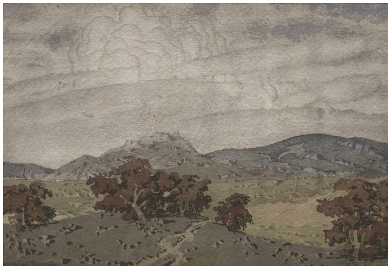
Рисунок М. А. Волошина с дарственной подписью К. В. Кандаурову: «Милому Константину Васильевичу — кусочек Коктебеля и моей души. Макс. 19 2/Х 24». Бумага, акварель.

Первенство Богаевского, как мастера, не означало дистанции, отличающая его манера письма не тяготела над другими, вызывая подражание. Напротив, Волошин, например, изображал Киммерию иначе — воздушной, лиричной, порой объединяя акварели в циклы или перемежая их поэтическими паузами, и этот лик крымского пейзажа, более камерный и нежный, Кандауров также представлял на московских выставках, открывая публике поэта в ипостаси художника.