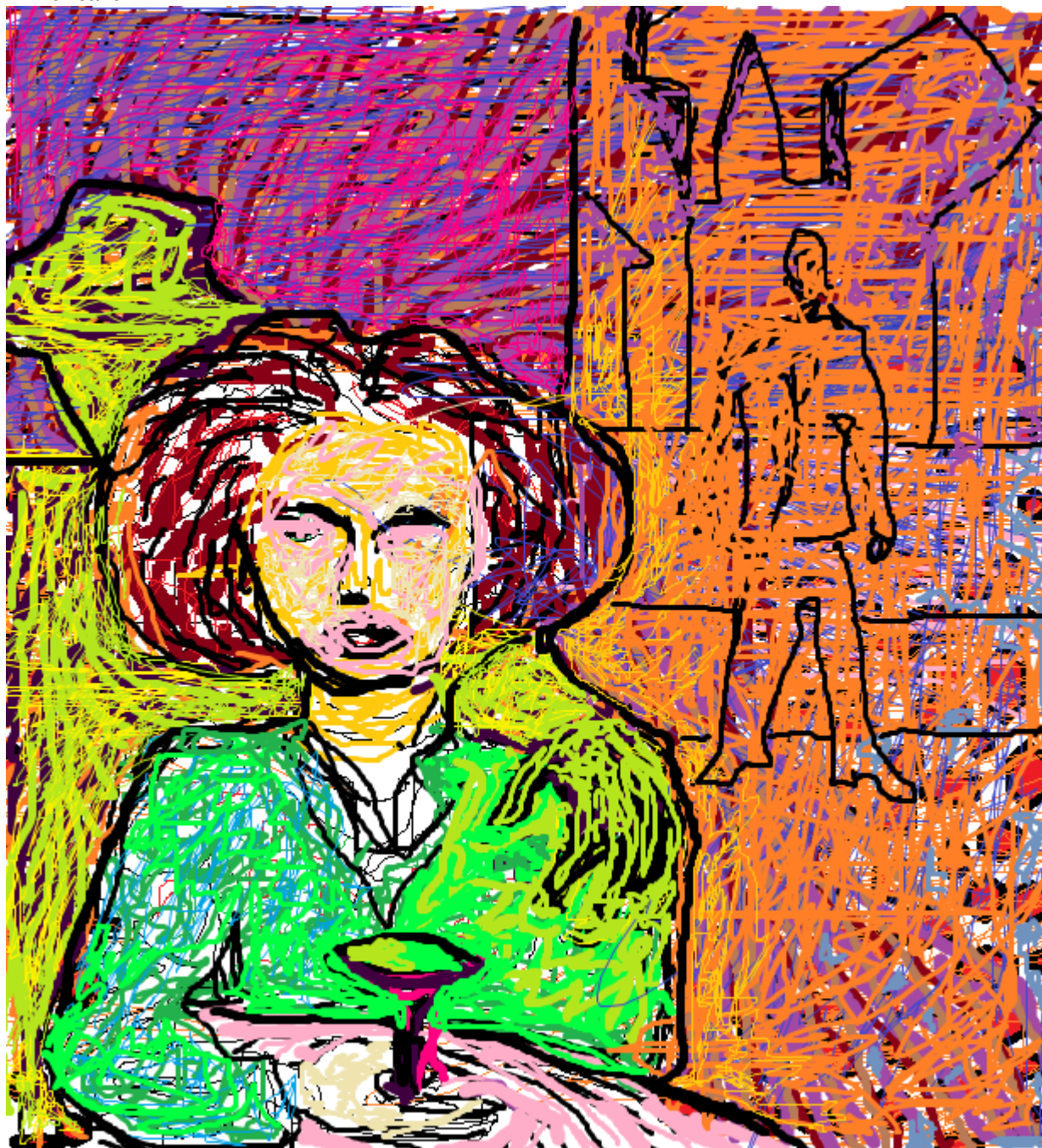
En el café