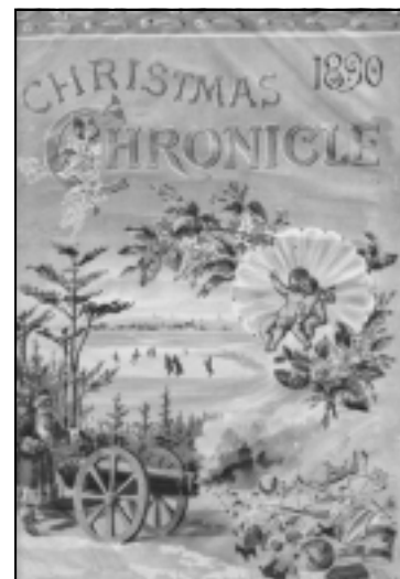
Quebec Chronicle. [Québec: s.n., 1890].

Des renseignements concernant le Programme décentralisé pour les