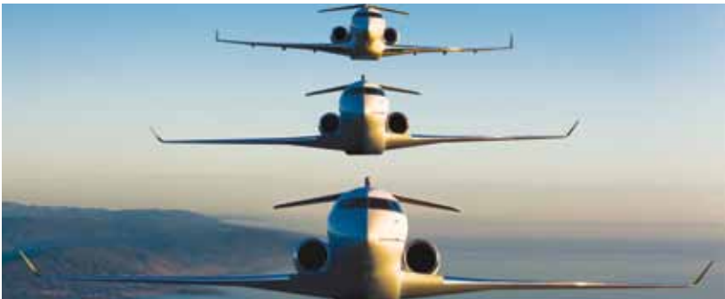
Trois avions de la famille Global de Bombardier Aéronautique. Salon international de l'aéronautique et de l'espace de Paris, 2011.