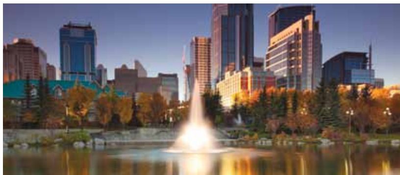
Vue du centre-ville de Calgary à partir du parc Prince's Island.