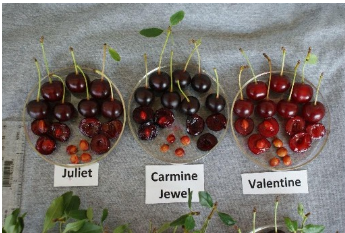
Cerisier: 'Juliet' (gauche) avec les variétés de référence 'Carmine Jewel' (centre) et 'Saint Valentine' (droite)