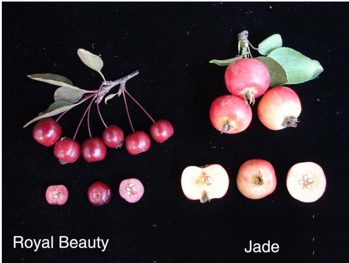
pommier: 'Jade' (droite) avec la variété de référence 'Royal Beauty' (gauche)

Épreuves et essais: Les essais ont été réalisés en 2008 à L'Acadie, au Québec. Ils ont porté sur 9 pommiers 'Jade' et 4 'Royal Beauty', espacés de 1,5 mètre sur le rang. Les rangs étaient espacés de 5 mètres.