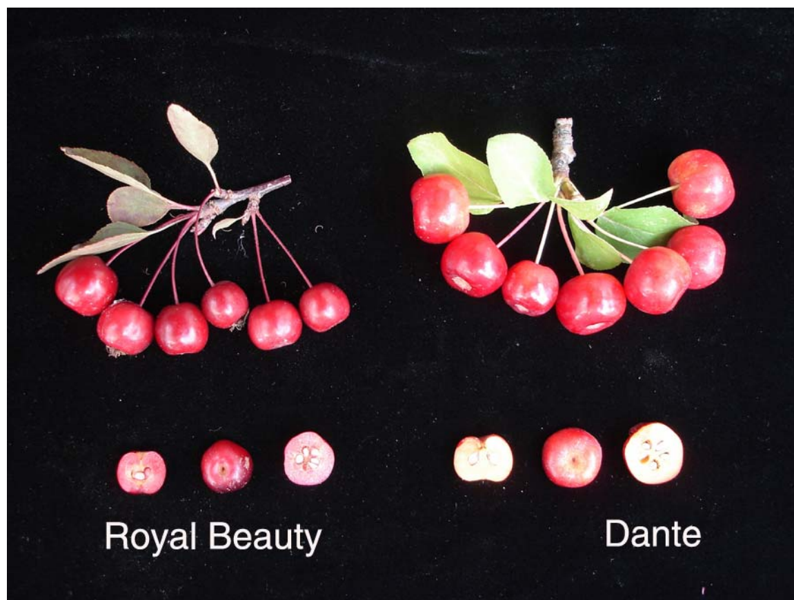
pommier: 'Dante' (droite) avec la variété de référence 'Royal Beauty' (gauche)

Épreuves et essais: Les essais ont été réalisés en 2008 à L'Acadie, au Québec. Ils ont porté sur 10 pommiers 'Dante', 9 'Jade' et 4 'Royal Beauty', espacés de 1,5 mètre sur le rang. Les rangs étaient espacés de 5 mètres.