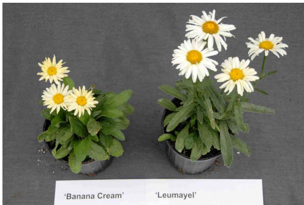
Marguerite: 'Banana Cream' (gauche) avec la variété de référence 'Leumayel' (droite)