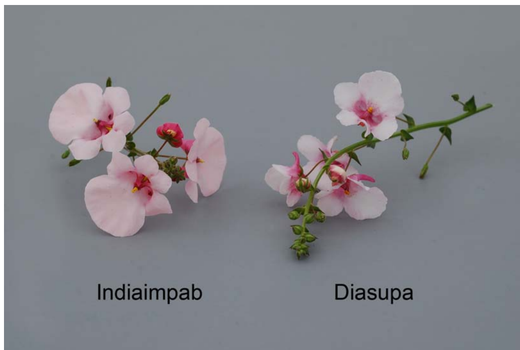
Diascia: 'Indiaimpab' (à gauche) avec la variété de référence (à droite)