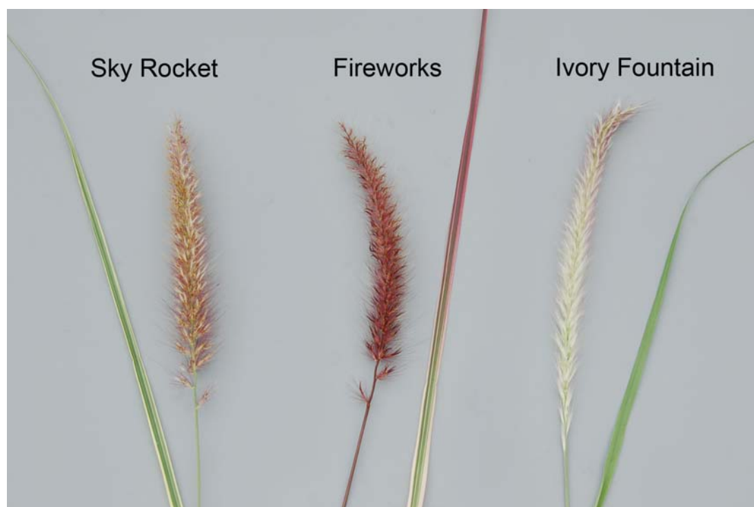
Pennisétum soyeux: 'Sky Rocket' (gauche) avec les variétés de référence 'Fireworks' (centre) et 'Ivory Fountain' (droite)