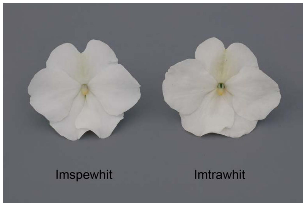
Impatiens: 'Imspewhit' (gauche) avec la variété de référence 'Imtrawhit' (droite)

Dénomination proposée: 'Imtracorbu' Noms commercial: Spellbound Coral Pink Butterfly, Spellbound Pink Splash Numéro de la demande: 09-6737 Date de la demande: 2008/10/14 (bénéfice de priorité) Requérant: Syngenta Crop Protection AG, Basel (Suisse) Mandataire au Canada: BioFlora Inc., St. Thomas (Ontario) Sélectionneur: Monica Sanders, Syngenta Seeds B.V., Enkhuizen (Pays-Bas)