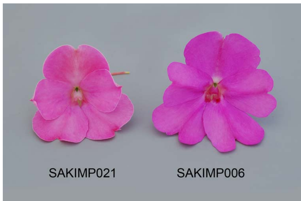
Impatiens: 'SAKIMP021' (gauche) avec la variété de référence 'SAKIMP006' (droite)