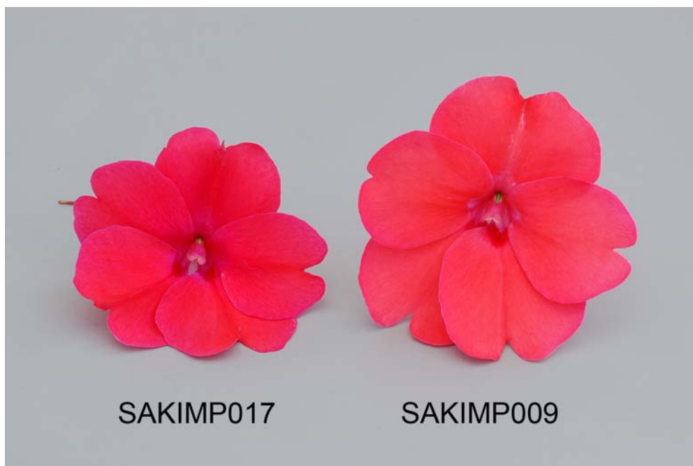
Impatiens: 'SAKIMP017' (gauche) avec la variété de référence 'SAKIMP009' (droite)