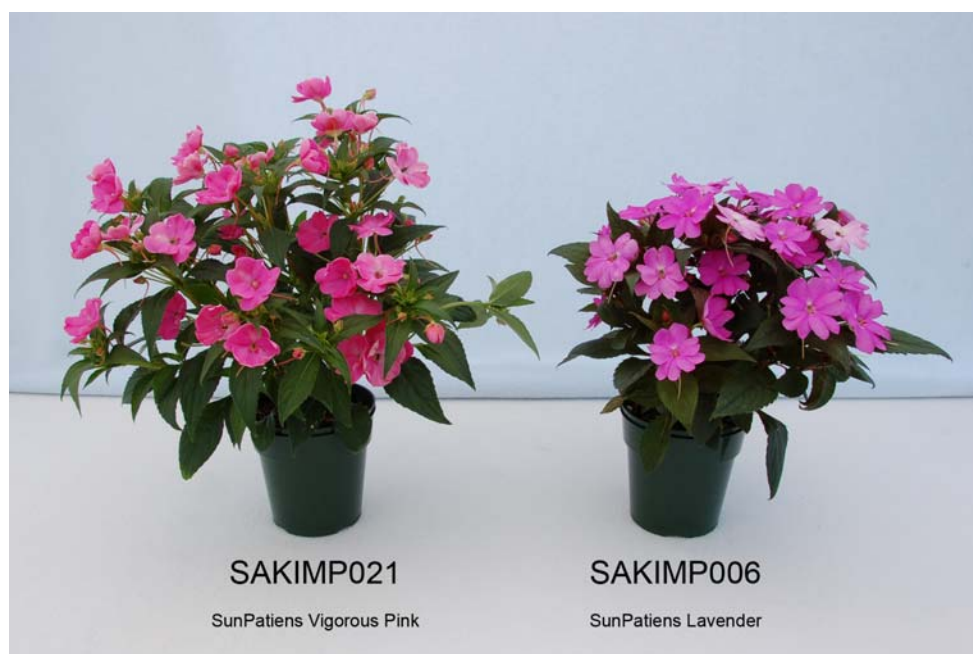
Impatiens: 'SAKIMP021' (gauche) avec la variété de référence 'SAKIMP006' (droite)