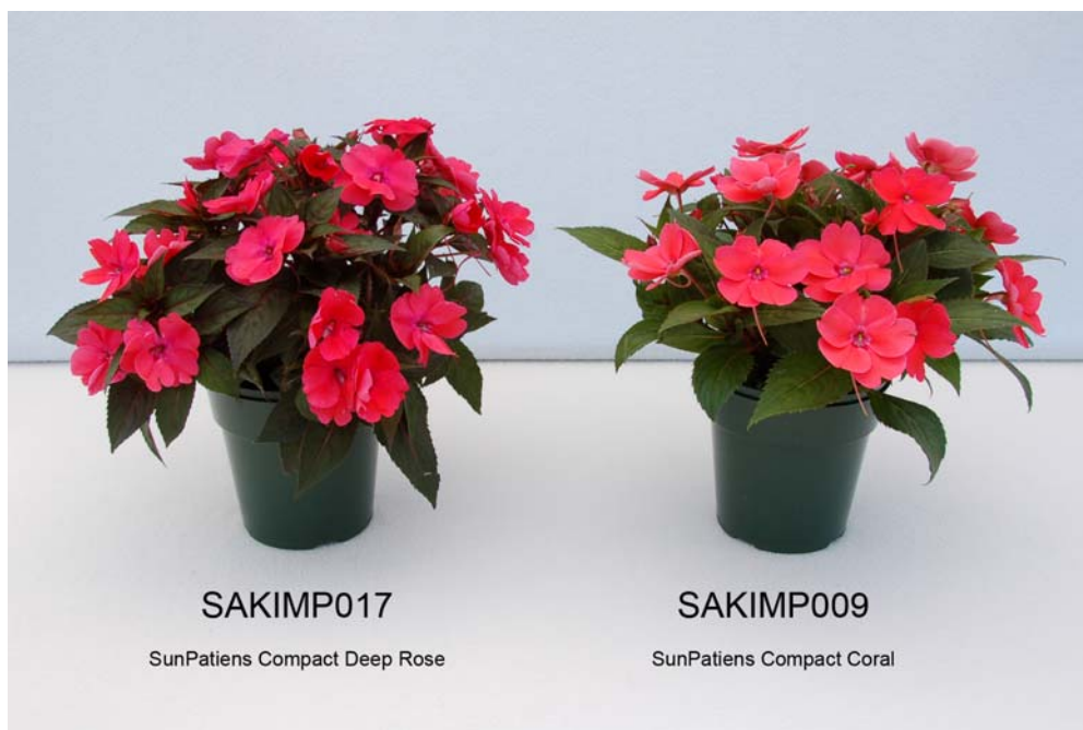
Impatiens: 'SAKIMP017' (gauche) avec la variété de référence 'SAKIMP009' (droite)