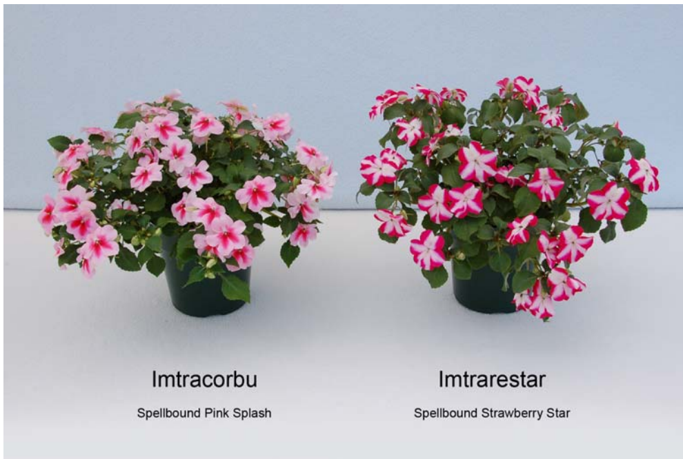
Impatiante: 'Imtracorbu' (gauche) avec la variété de référence 'Imtrarestar' (droite)