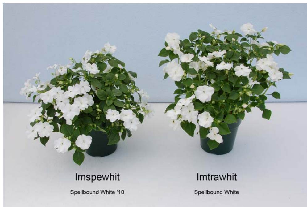
Impatiens: 'Imspewhit' (gauche) avec la variété de référence 'Imtrawhit' (droite)