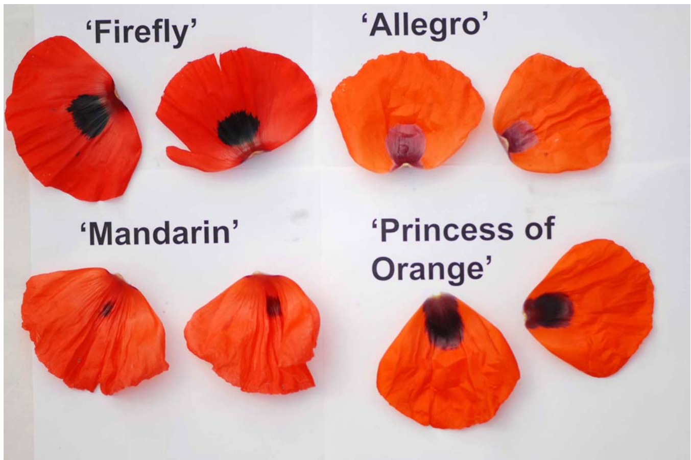
Pavot d'Orient: 'Mandarin' (en bas, à gauche) avec les variétés de référence 'Firefly' (en haut, à gauche), 'Allegro' (en haut, à droite) et 'Princess of Orange' (en bas, à droite)