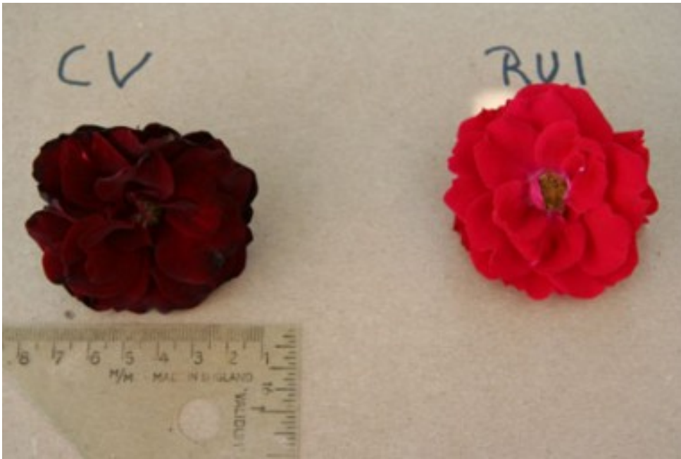
Rosier: 'Navy Lady' (gauche) avec la variété de référence 'Champlain' (droite)