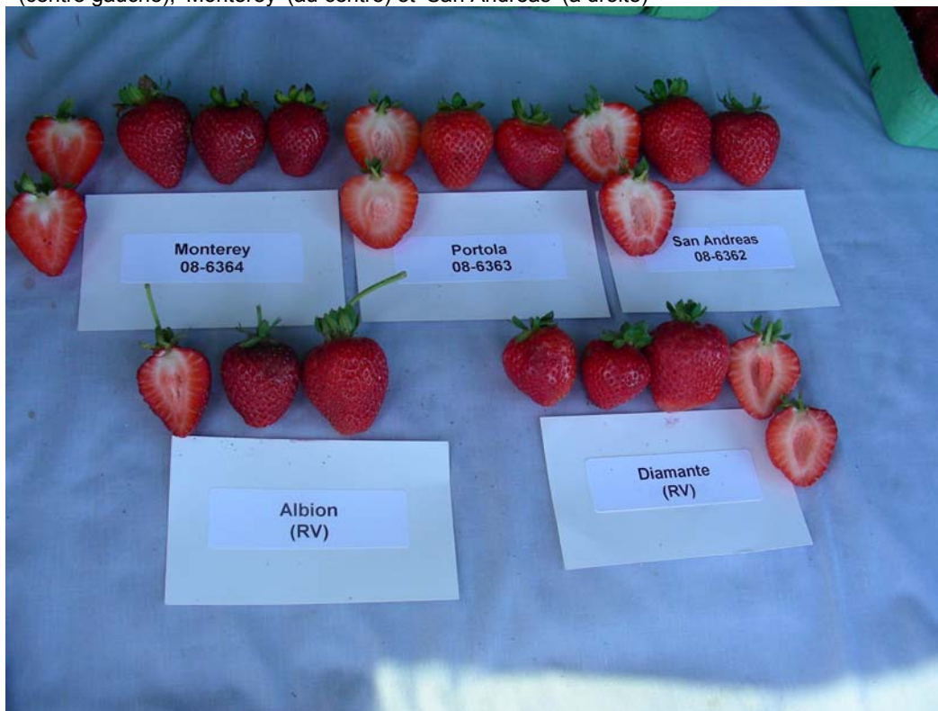
Fraisier: 'Portola' (en haut au centre) avec les variétés de référence 'Monterey' (en haut à gauche), 'San Andreas' (en haut à droite), 'Albion' (en bas à gauche) et 'Diamante' (en bas à droite)