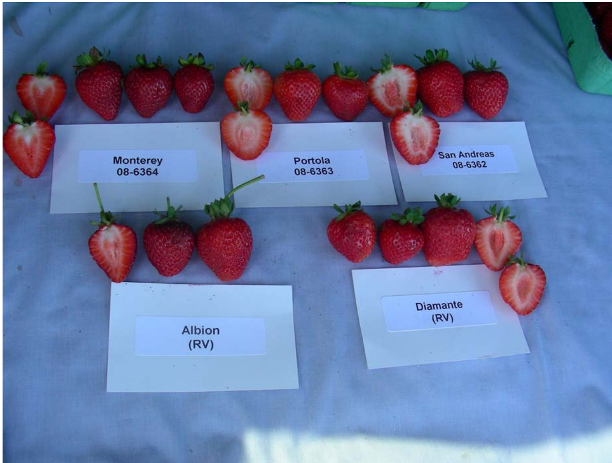
Fraisier: 'Monterey' (en haut à gauche) avec les variétés de référence 'Portola' (en haut au centre), 'San Andreas' (en haut à droite), 'Albion' (en bas à gauche) et 'Diamante' (en bas à droite)

Dénomination proposée: 'Palomar' Numéro de la demande: 07-5899 Date de la demande: 2007/01/16 (bénéfice de priorité) Requérant: The Regents of the University of California, Oakland, Californie (États-Unis) Mandataire au Canada: Expert Agriculture Team Ltd., Chilliwack (Colombie-Britannique) Sélectionneur: Kirk D. Larson, Irvine, Californie (États-Unis) Douglas Shaw, Davis, Californie (États-Unis)