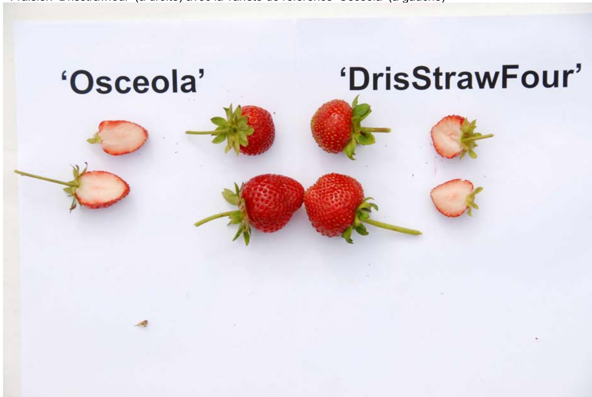
Fraisier: 'Drisstrawfour' (à droite) avec la variété de référence 'Osceola' (à gauche)