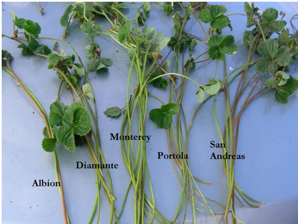
Fraisier: 'Portola' (centre droite) avec les variétés de référence 'Albion' (à gauche), 'Diamante' (centre gauche), 'Monterey' (au centre) et 'San Andreas' (à droite)