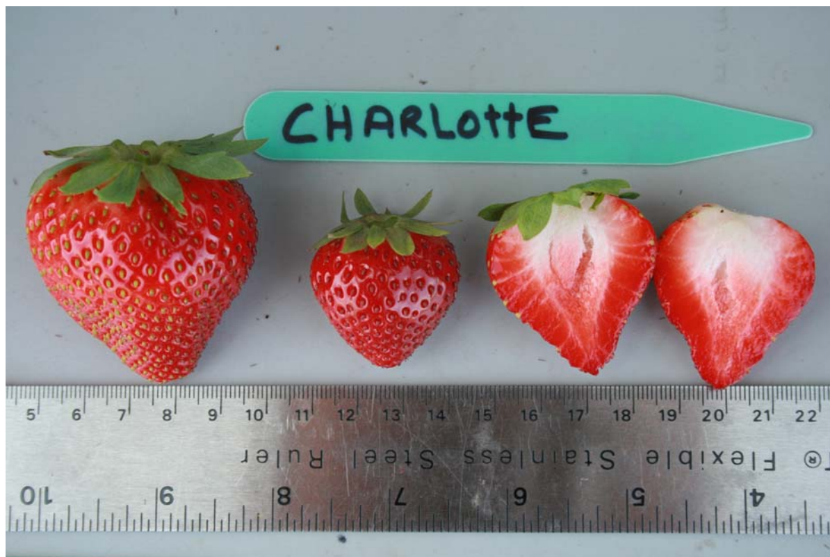
Fraisier: Variété candidate 'Charlotte'

Épreuves et essais: Les épreuves et essais ont été réalisés au cours de l'été 2008 à Lavaltrie, au Québec. Les essais ont porté sur 100 sujets de chaque variété, espacés de 30 cm sur des rangs espacés de 130 cm.