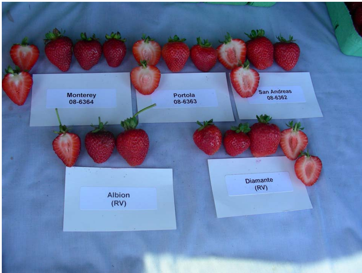
Fraisier: 'San Andreas' (en haut à droite) avec les variétés de référence 'Monterey' (en haut à gauche), 'Portola' (en haut au centre), 'Albion' (en bas à gauche) et 'Diamante' (en bas à droite)