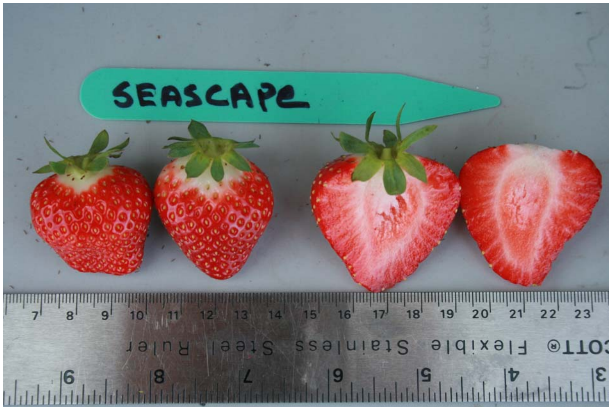
Fraisier: Variété de référence 'Seascape'