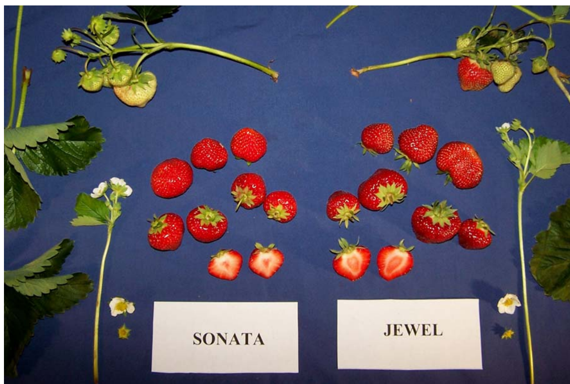
Fraisier: 'Sonata' (à gauche) avec la variété de référence 'Jewel' (à droite)