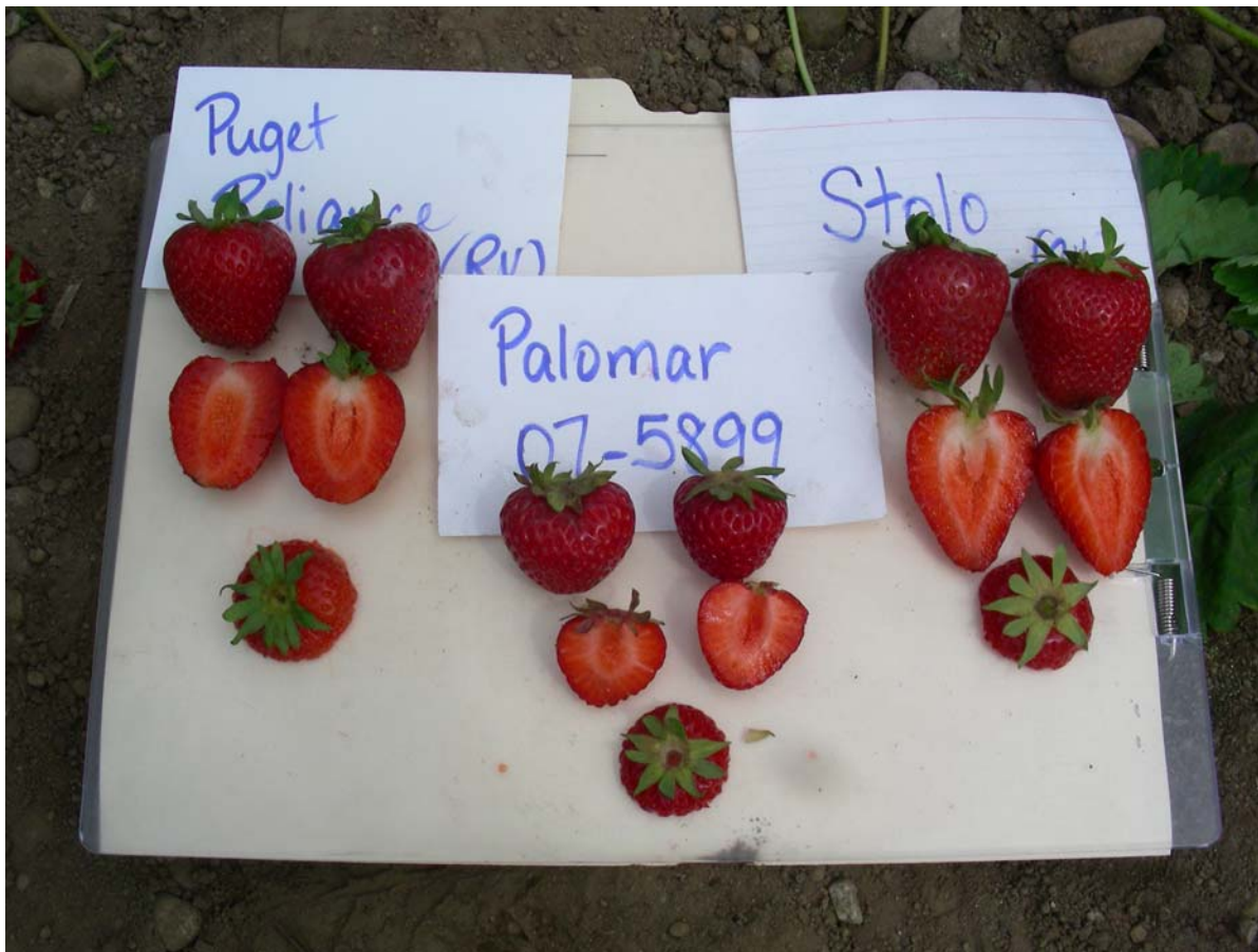
Fraisier: 'Palomar' (au centre) avec les variétés de référence 'Puget Reliance' (à gauche) et 'Stolo' (à droite)