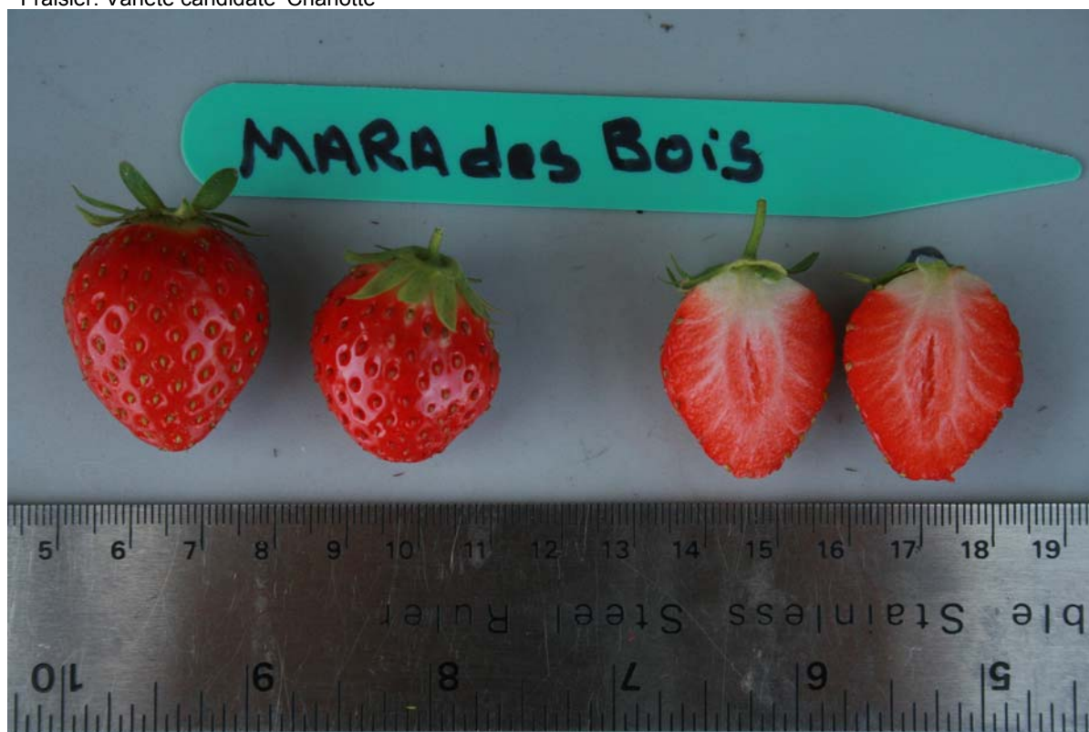
Fraisier: Variété de référence 'Mara des Bois'