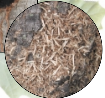
Sawdust • Sciure