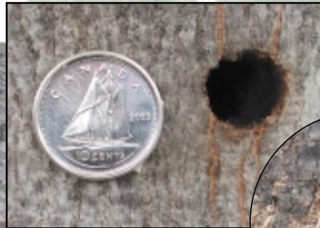
Exit hole • Trou d'émergence