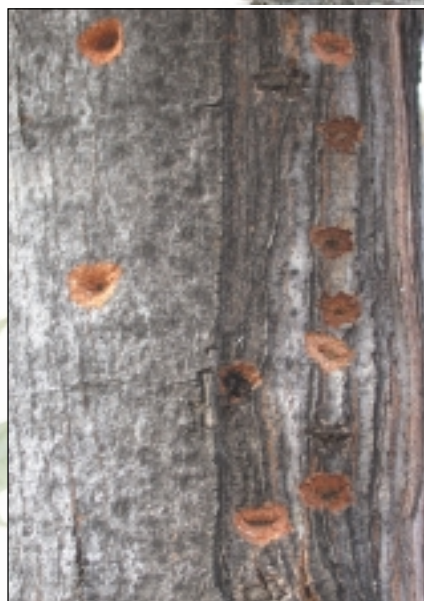
Egg-laying scars • Marques indiquant les sites de ponte

Birch • Elm • Hackberry Horse Chestnut • Maple Mountain Ash • Poplar Silk Tree • Sycamore • Willow