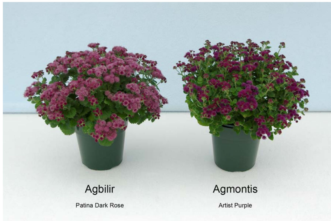
Agérate: 'Agbilir' (à gauche) avec la variété de référence 'Agmontis' (à droite)