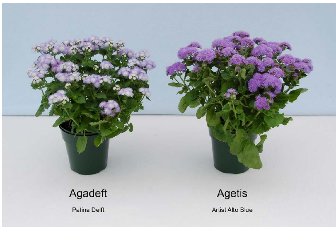
Agérate: 'Agadefit' (à gauche) avec la variété de référence 'Agetis' (à droite)