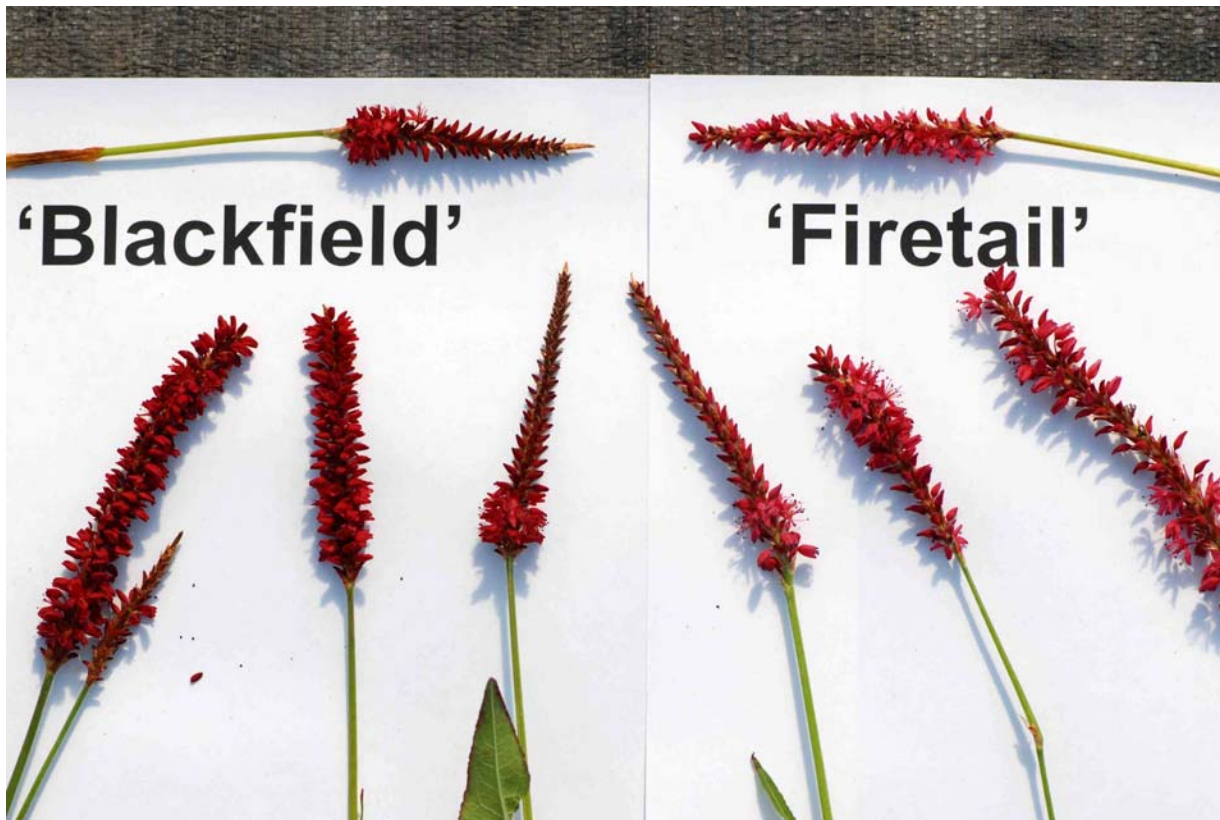
Renouée: 'Blackfield' (gauche) avec la variété de référence 'Firetail' (droite)