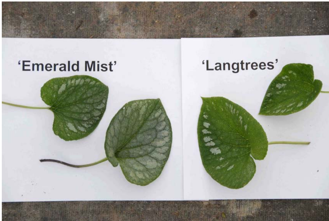
Brunnera: 'Emerald Mist' (gauche) avec la variété de référence 'Langtrees' (droite)