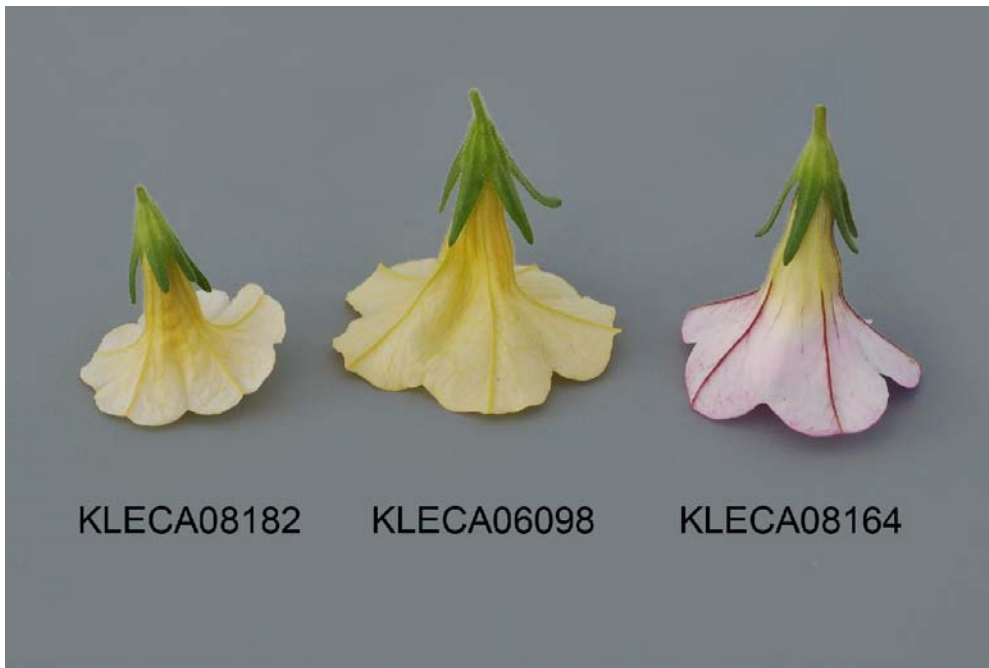
Calibrachoa: 'KLECA08182' (gauche) avec les variétés de référence 'KLECA06098' (centre) et 'KLECA08164' (droite)