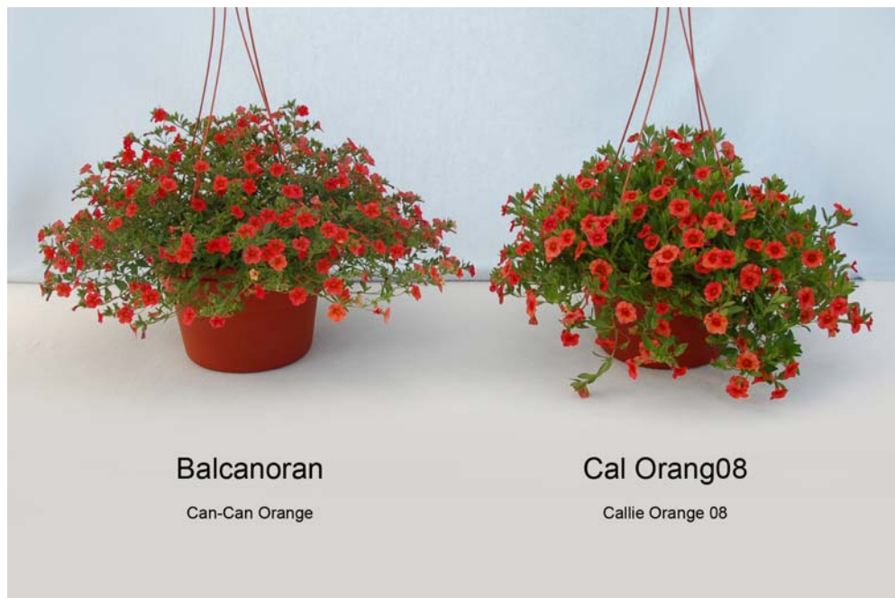
Calibrachoa: 'Balcanoran' (gauche) avec la variété de référence 'Cal Orang08' (droite)