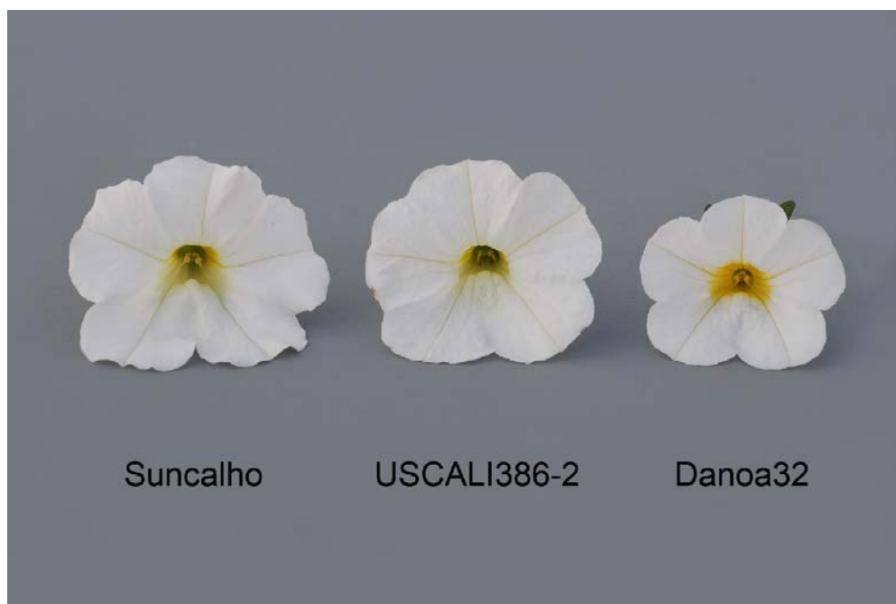
Calibrachoa: 'Suncalho' (gauche) avec les variétés de référence 'USCALI386-2' (centre) et 'Danoa32' (droite)