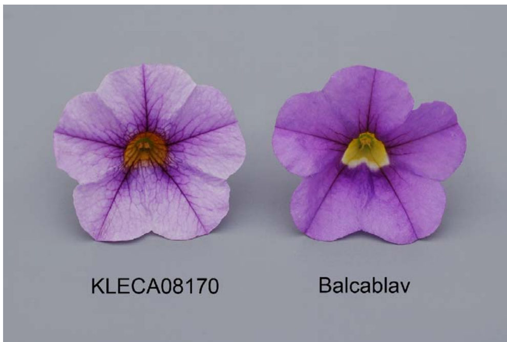
Calibrachoa: 'KLECA08170' (gauche) avec la variété de référence 'Balcablav' (droite)