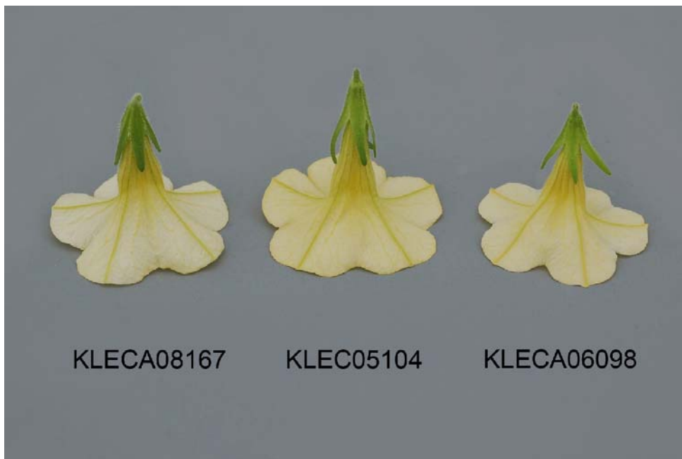
Calibrachoa: 'KLECA08167' (gauche) avec les variétés de référence 'KLEC05104' (centre) et 'KLECA06098' (droite)