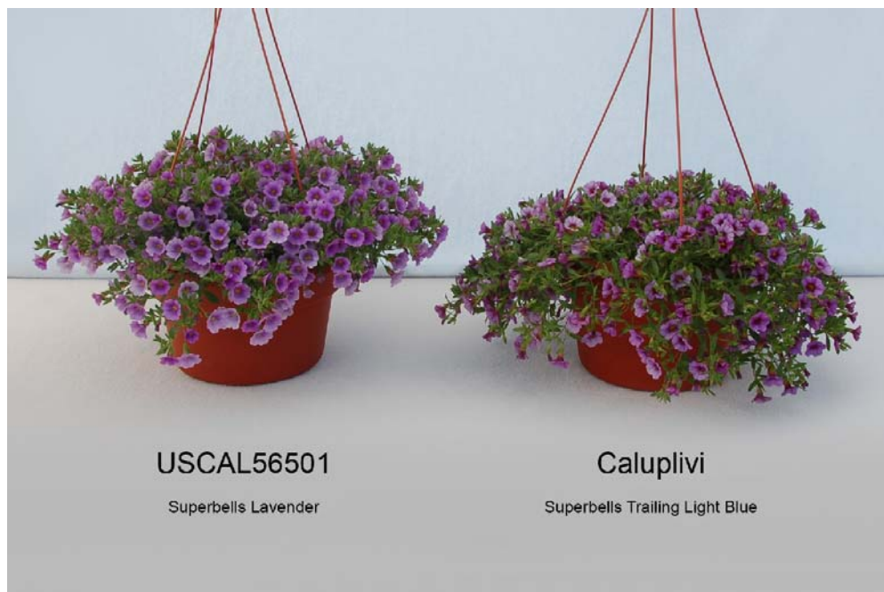
Calibrachoa: 'USCAL56501' (gauche) avec la variété de référence 'Caluplivi' (droite)