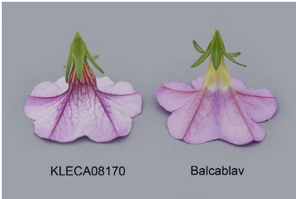
Calibrachoa: 'KLECA08170' (gauche) avec la variété de référence 'Balcablav' (droite)