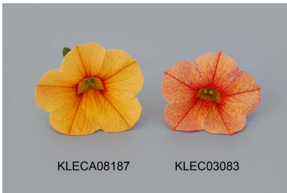
Calibrachoa: 'KLECA08187' (gauche) avec la variété de référence 'KLEC03083' (droite)