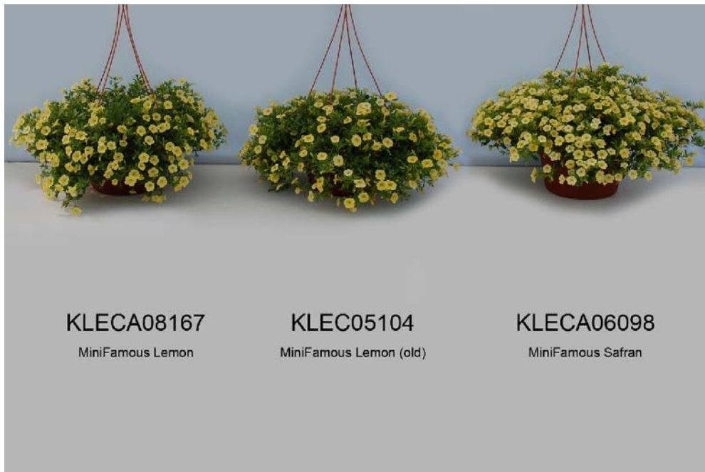
Calibrachoa: 'KLECA08167' (gauche) avec les variétés de référence 'KLEC05104' (centre) et 'KLECA06098' (droite)