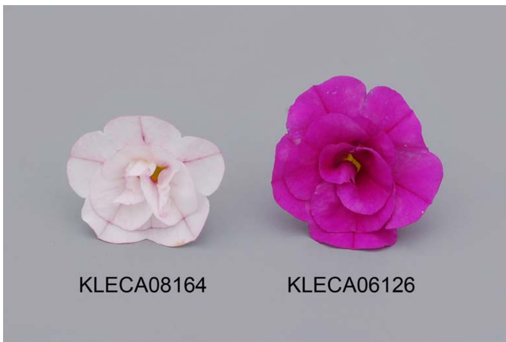
Calibrachoa: 'KLECA08164' (gauche) avec la variété de référence 'KLECA06126' (droite)