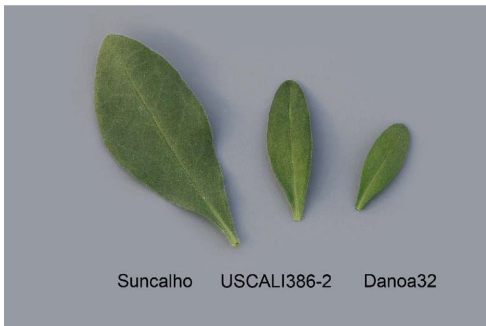
Calibrachoa: 'Suncalho' (gauche) avec les variétés de référence 'USCALI386-2' (centre) et 'Danoa32' (droite)

Dénomination proposée: 'USCAL48804' Nom commercial: Superbells Pink Gem Numéro de la demande: 09-6586 Date de la demande: 2009/03/27 Requérant: Plant 21 LLC, Bonsall, Californie (États-Unis) Mandataire au Canada: BioFlora Inc., St. Thomas (Ontario) Sélectionneur: Ushio Sakazaki, Shiga (Japon)