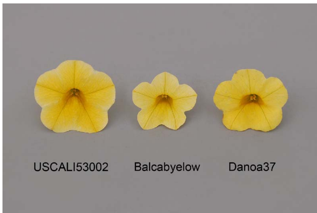
Calibrachoa: 'USCAL53002' (gauche) avec les variétés de référence 'Balcabyelow' (centre) et 'Danoa37' (droite)