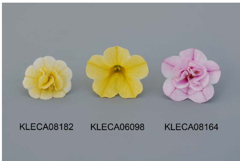
Calibrachoa: 'KLECA08182' (gauche) avec les variétés de référence 'KLECA06098' (centre) et 'KLECA08164' (droite)