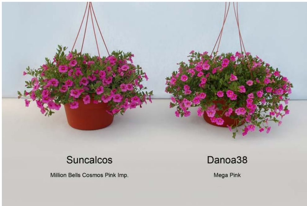
Calibrachoa: 'Suncalcos' (gauche) avec la variété de référence 'Danoa38' (droite)