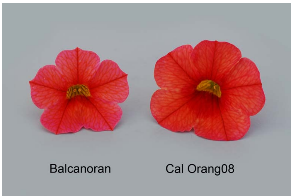
Calibrachoa: 'Balcanoran' (gauche) avec la variété de référence 'Cal Orang08' (droite)