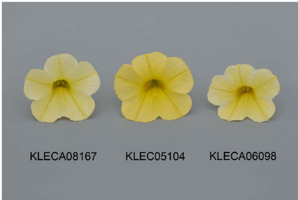
Calibrachoa: 'KLECA08167' (gauche) avec les variétés de référence 'KLEC05104' (centre) et 'KLECA06098' (droite)