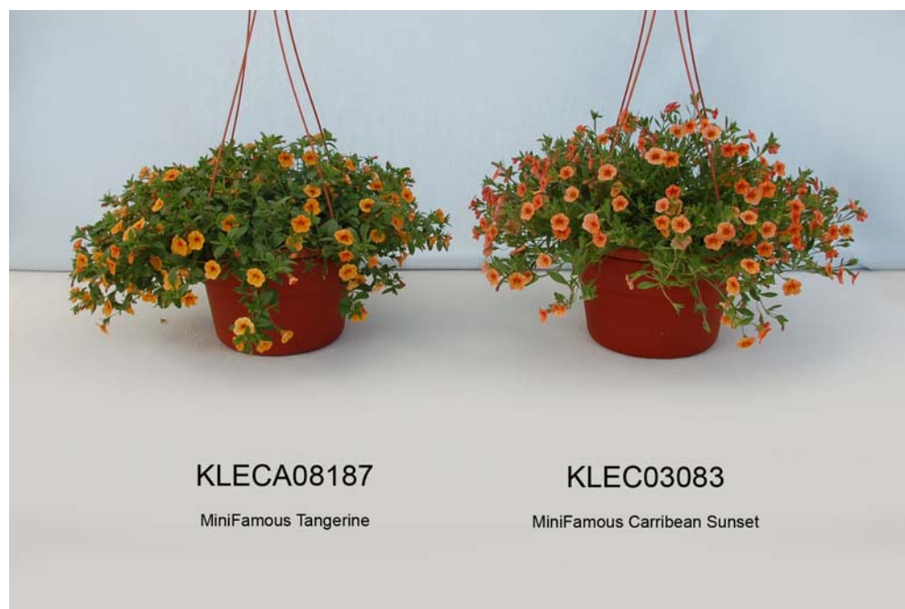
Calibrachoa: 'KLECA08187' (gauche) avec la variété de référence 'KLEC03083' (droite)