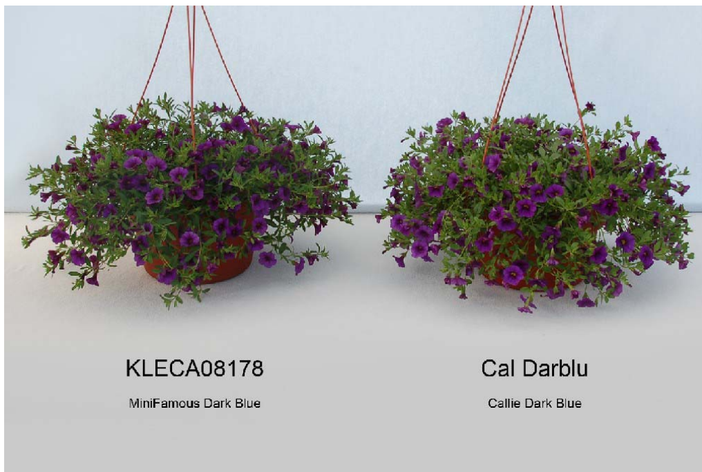
Calibrachoa: 'KLECA08178' (gauche) avec la variété de référence 'Cal Darblu' (droite)