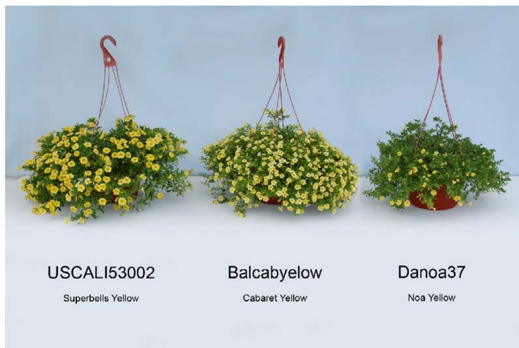
Calibrachoa: 'USCAL53002' (gauche) avec les variétés de référence 'Balcabyelow' (centre) et 'Danoa37' (droite)