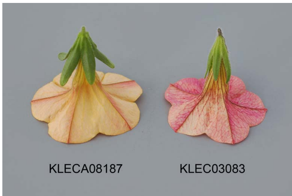
Calibrachoa: 'KLECA08187' (gauche) avec la variété de référence 'KLEC03083' (droite)

Dénomination proposée: 'Suncalcos' Nom commercial: Million Bells Cosmos Pink Improved Numéro de la demande: 09-6571 Date de la demande: 2009/03/25 Requérant: Suntory Flowers Limited, Tokyo (Japon) Mandataire au Canada: BioFlora Inc., St. Thomas (Ontario) Sélectionneur: Takeshi Kanaya, Suntory Flowers Limited, Shiga (Japon)