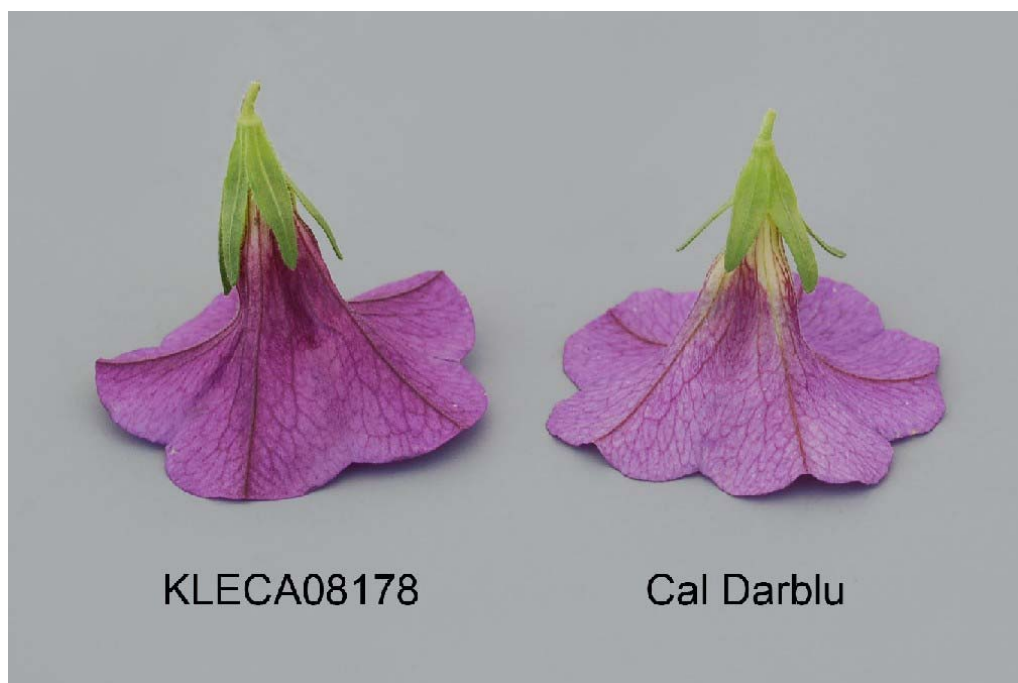
Calibrachoa: 'KLECA08178' (gauche) avec la variété de référence 'Cal Darblu' (droite)