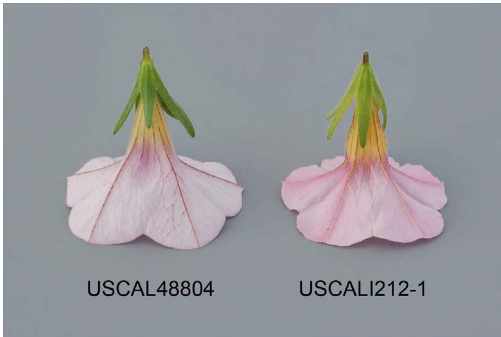
Calibrachoa: 'USCAL48804' (gauche) avec la variété de référence 'USCALI212-1' (droite)

Dénomination proposée: 'USCAL53002' Nom commercial: Superbells Yellow Numéro de la demande: 09-6587 Date de la demande: 2009/03/27 Requérant: Plant 21 LLC, Bonsall, Californie (États-Unis) Mandataire au Canada: BioFlora Inc., St. Thomas (Ontario) Sélectionneur: Ushio Sakazaki, Shiga (Japon)