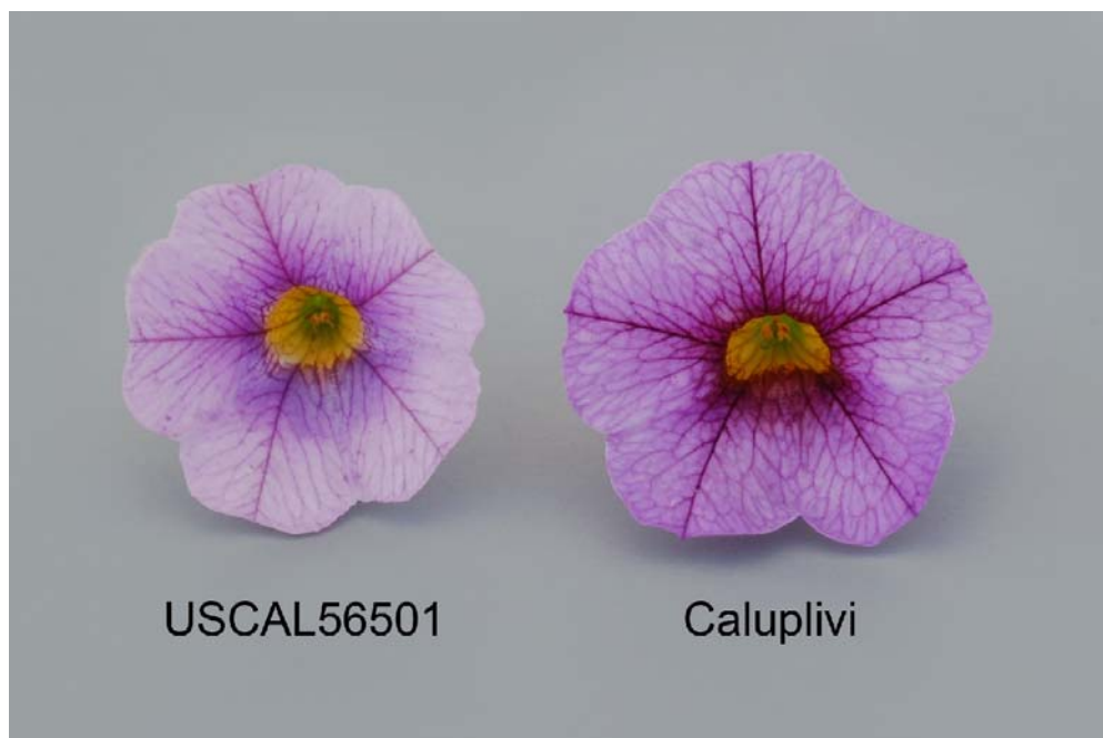
Calibrachoa: 'USCAL56501' (gauche) avec la variété de référence 'Caluplivi' (droite)