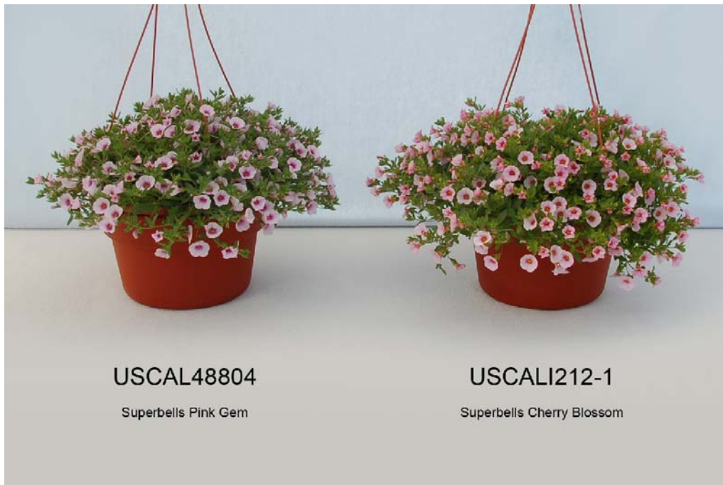
Calibrachoa: 'USCAL48804' (gauche) avec la variété de référence 'USCALI212-1' (droite)