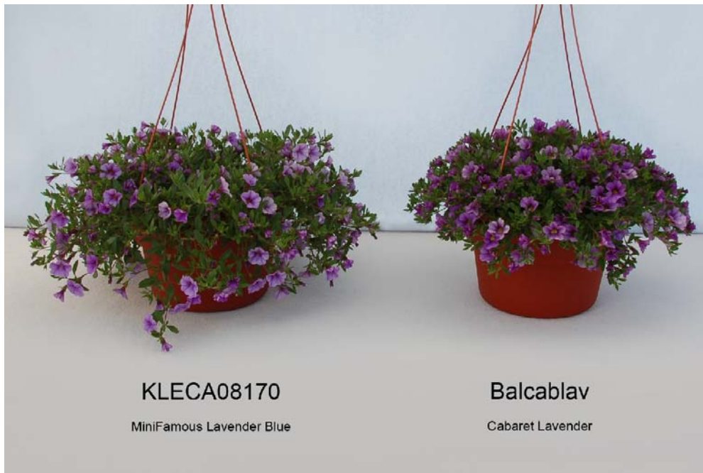
Calibrachoa: 'KLECA08170' (gauche) avec la variété de référence 'Balcablav' (droite)