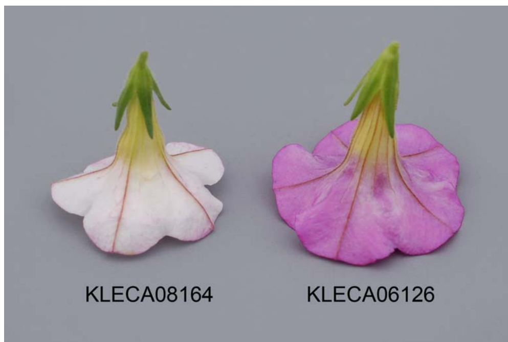
Calibrachoa: 'KLECA08164' (gauche) avec la variété de référence 'KLECA06126' (droite)