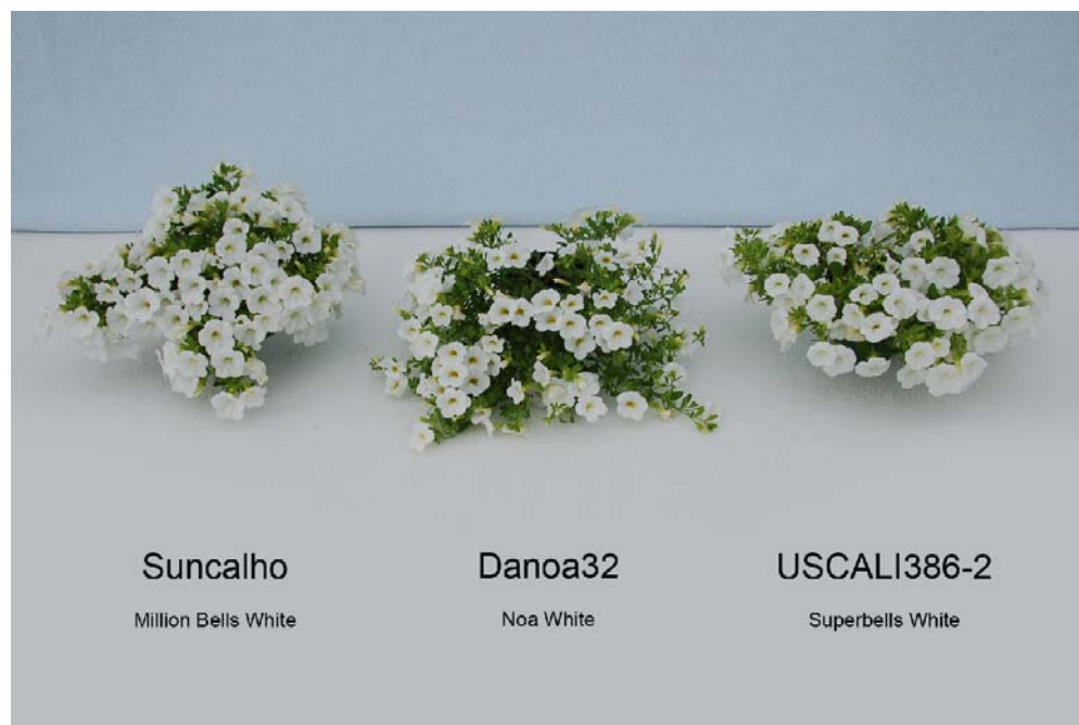
Calibrachoa: 'Suncalho' (gauche) avec les variétés de référence 'Danoa32' (centre) et 'USCALI386-2' (droite)