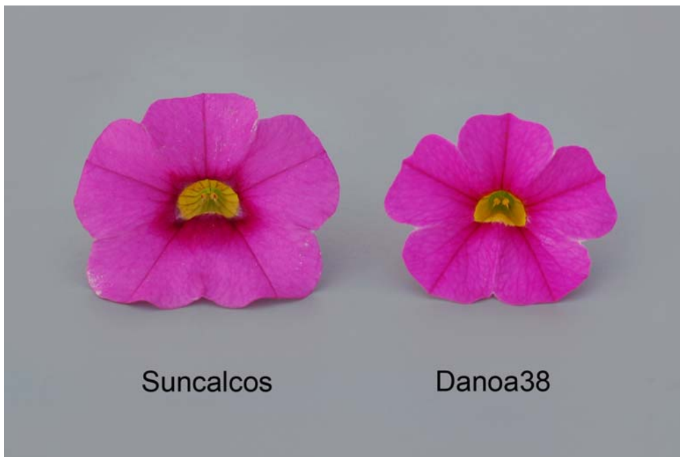
Calibrachoa: 'Suncalcos' (gauche) avec la variété de référence 'Danoa38' (droite)