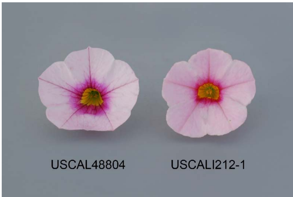
Calibrachoa: 'USCAL48804' (gauche) avec la variété de référence 'USCALI212-1' (droite)