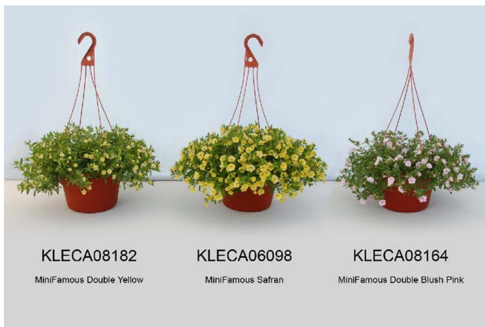
Calibrachoa: 'KLECA08182' (gauche) avec les variétés de référence 'KLECA06098' (centre) et 'KLECA08164' (droite)