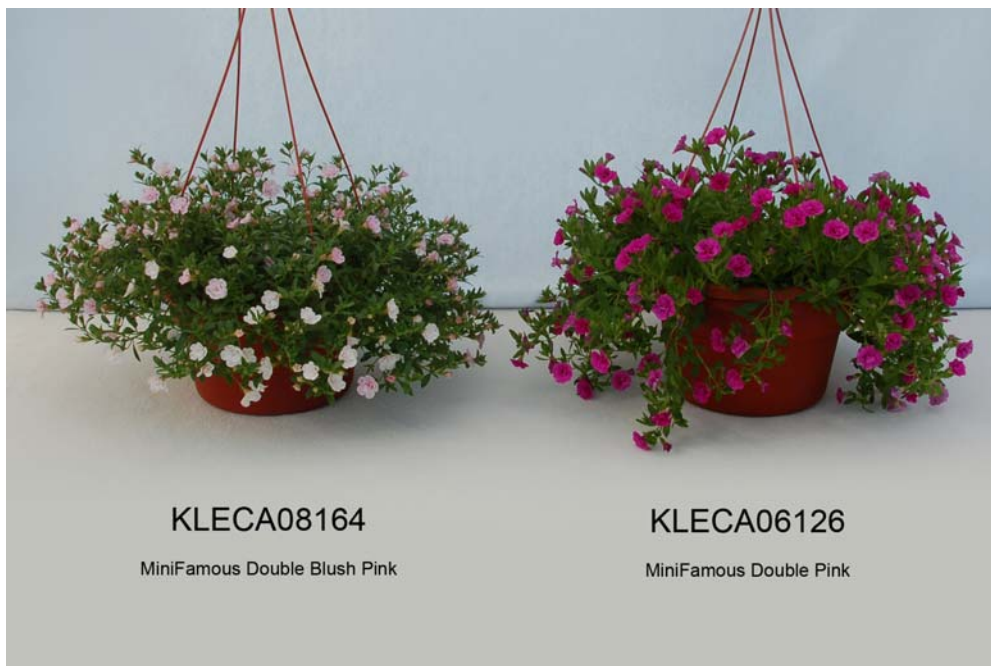
Calibrachoa: 'KLECA08164' (gauche) avec la variété de référence 'KLECA06126' (droite)