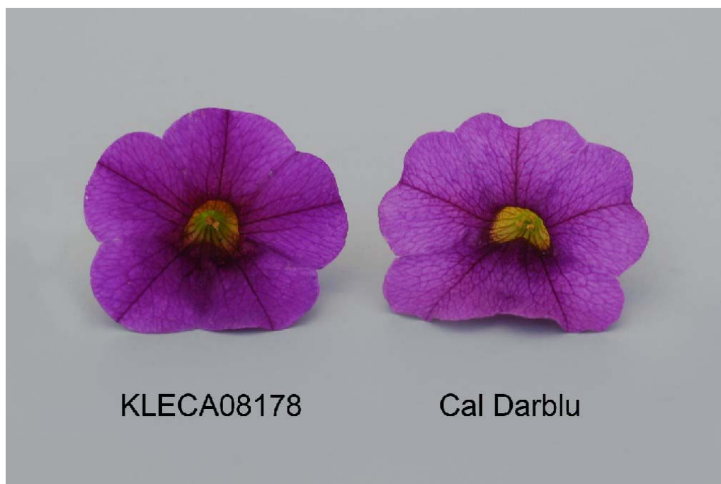
Calibrachoa: 'KLECA08178' (gauche) avec la variété de référence 'Cal Darblu' (droite)