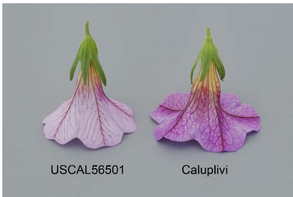
Calibrachoa: 'USCAL56501' (gauche) avec la variété de référence 'Caluplivi' (droite)