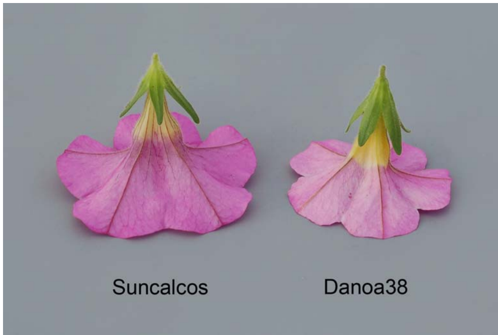
Calibrachoa: 'Suncalcos' (gauche) avec la variété de référence 'Danoa38' (droite)