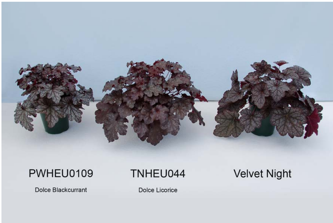
Heuchère: 'PWHEU0109' (à gauche) avec les variétés de référence 'TNHEU044' (au centre) et 'Velvet Night' (à droite)