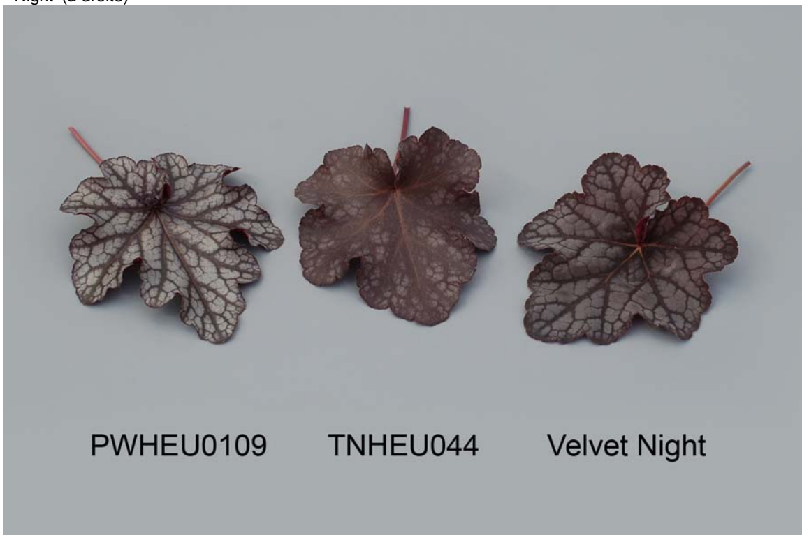
Heuchère: 'PWHEU0109' (à gauche) avec les variétés de référence 'TNHEU044' (au centre) et 'Velvet Night' (à droite)