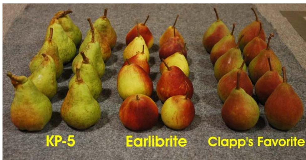
Poirier: 'Little Elephant' (gauche) avec les variétés de référence 'Earlibrite' (centre) et 'Clapp's Favourite' (droite)