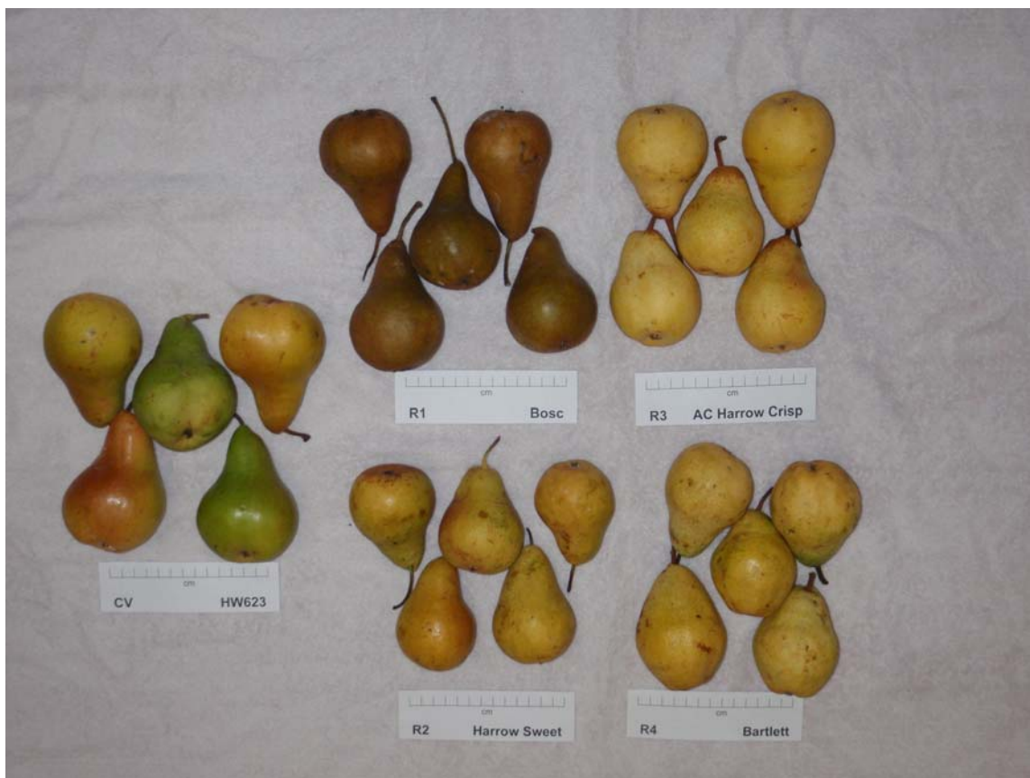
Poirier: 'HW623' (gauche) avec les variétés de références 'Bosc' (en haut au centre), 'AC Harrow Crisp' (en haut à droite), 'Harrow Sweet' (en bas au centre) et 'Bartlett' (en bas à droite)