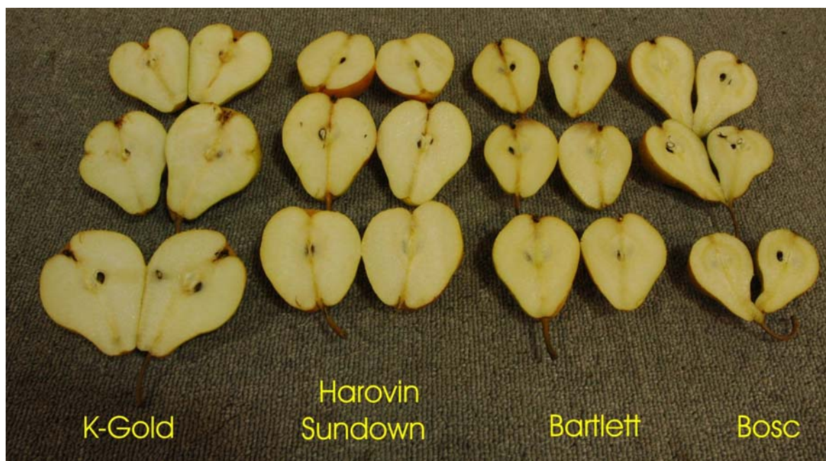
Poirier: 'K-Gold' (gauche) avec les variétés de références 'Harovin Sundown' (centre gauche), 'Bartlett' (centre droite) et 'Bosc' (droite)