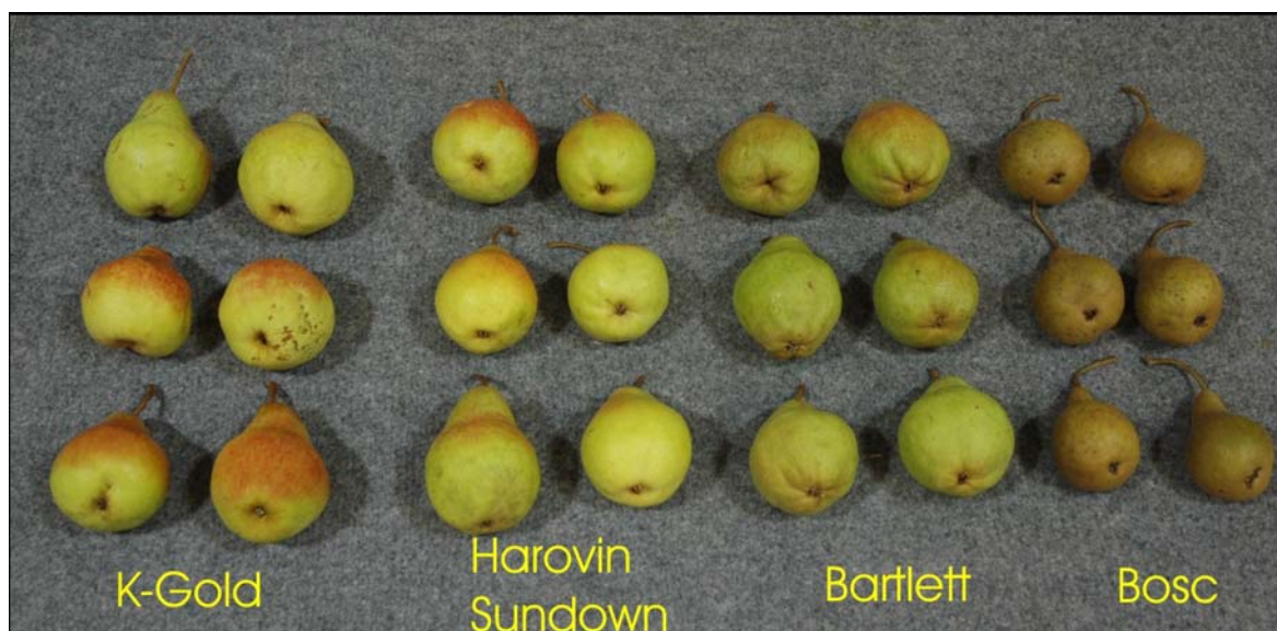
Poirier: 'K-Gold' (gauche) avec les variétés de références 'Harovin Sundown' (centre gauche), 'Bartlett' (centre droite) et 'Bosc' (droite)