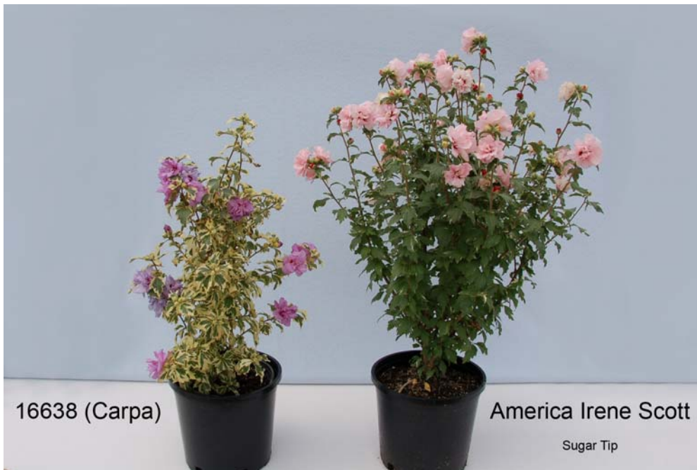
Mauve en arbre: 'Carpa' (gauche) avec la variété de référence 'America Irene Scott' (droite)