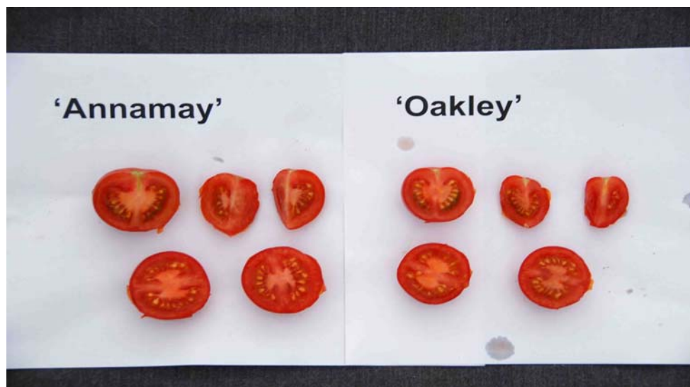
Tomate: 'Annamay' (gauche) avec la variété de référence 'Oakley' (droite)