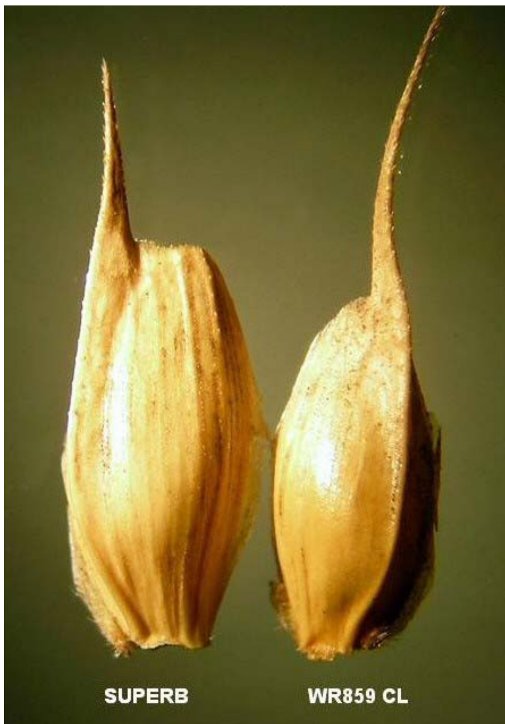
Blé: 'WR859 CL' (droite) avec la variété de référence 'Superb' (gauche)