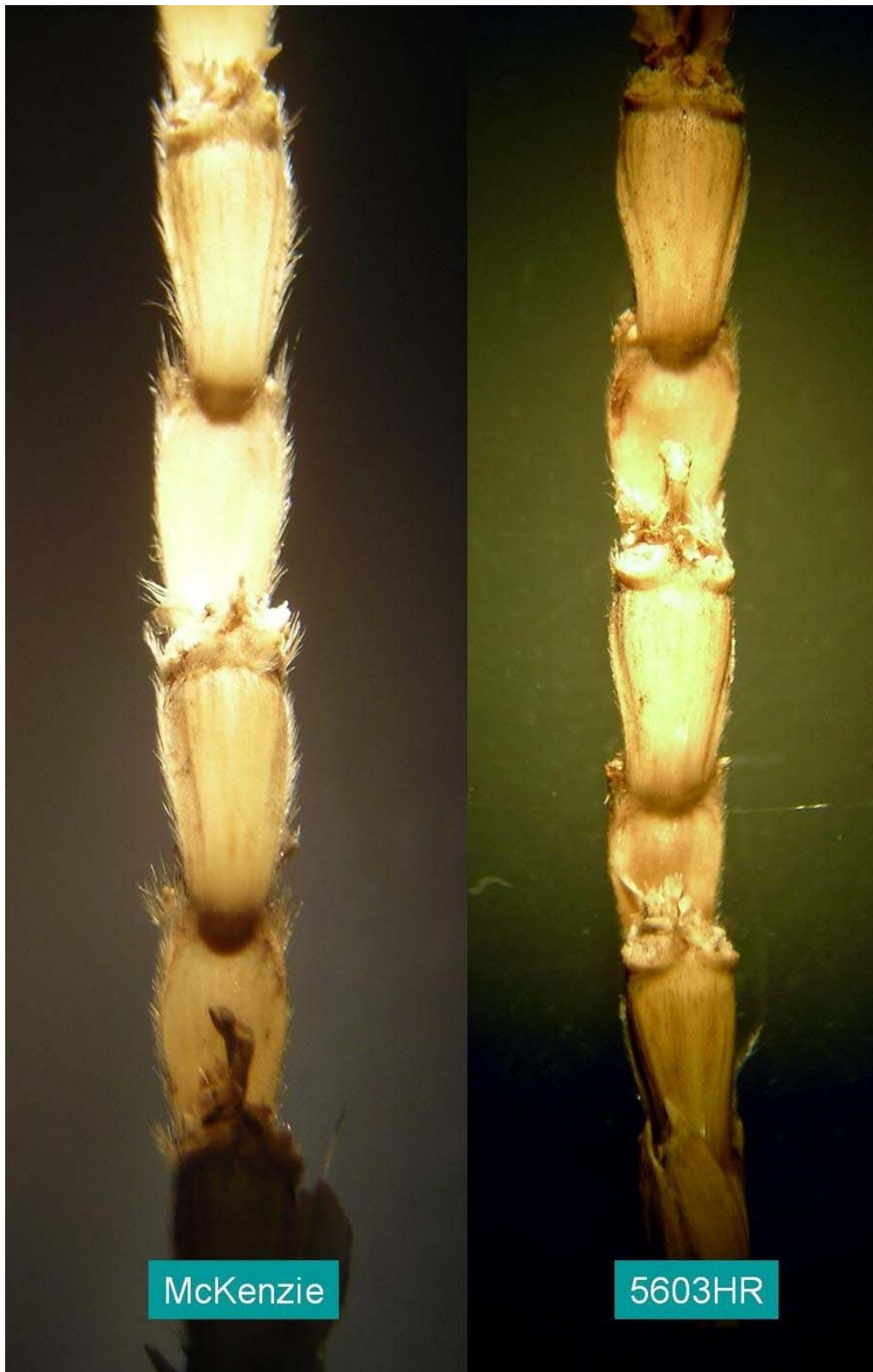
Blé: '5603HR' (droite) avec la variété de référence 'McKenzie' (gauche)