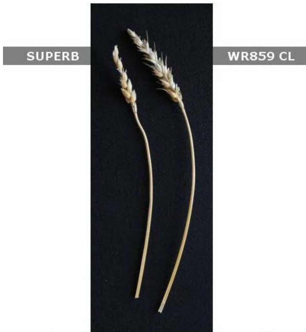
Blé: 'WR859 CL' (droite) avec la variété de référence 'Superb' (gauche)