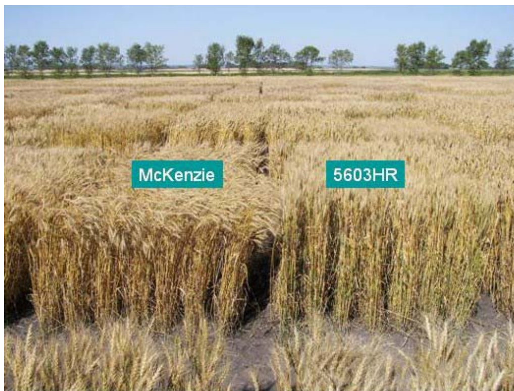
Blé: '5603HR' (droite) avec la variété de référence 'McKenzie' (gauche)

Dénomination proposée: 'WR859 CL' Numéro de la demande: 08-6393 Date de la demande: 2008/06/26 Requérant: Syngenta Seeds Canada, Inc., Morden (Manitoba) Sélectionneur: Kevin McCallum, Syngenta Seeds Canada, Inc., Morden (Manitoba)