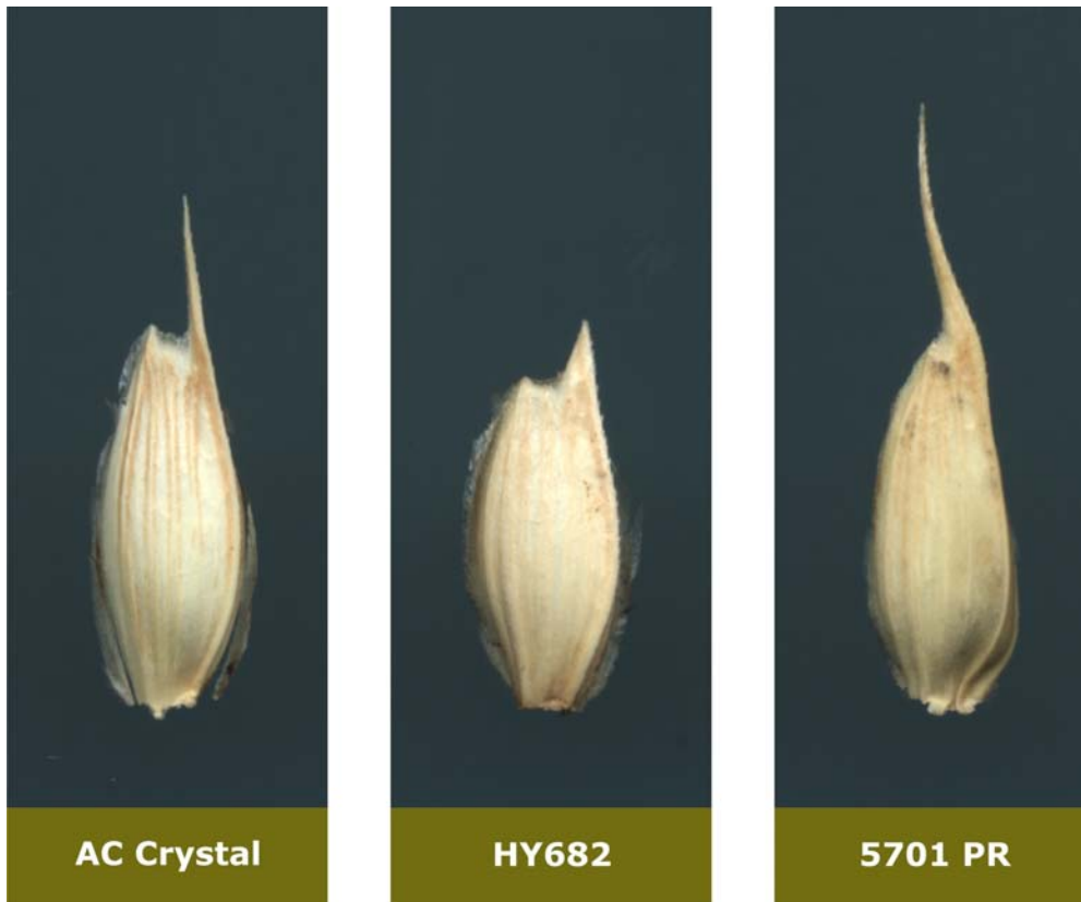
Blé: 'Conquer' (centre) avec les variétés de référence 'AC Crystal' (gauche) et '5701PR' (droite)