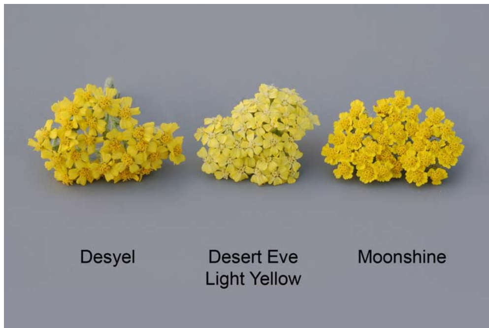
Achillée: 'Desyel' (gauche) avec les variétés de références 'Desert Eve Light Yellow' (centre) et 'Moonshine' (droite)