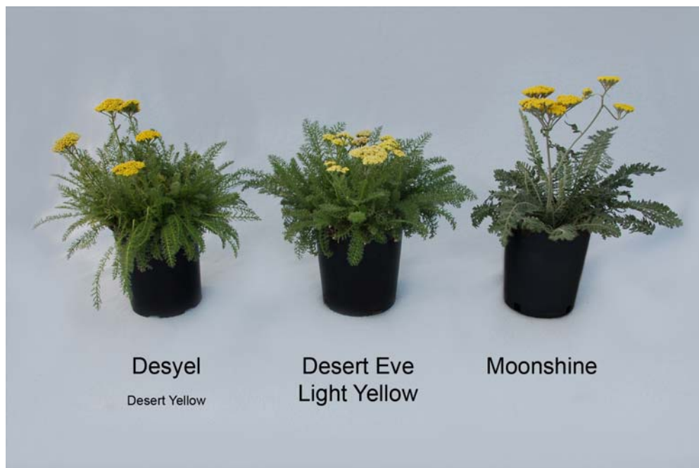
Achillée: 'Desyel' (gauche) avec les variétés de références 'Desert Eve Light Yellow' (centre) et 'Moonshine' (droite)